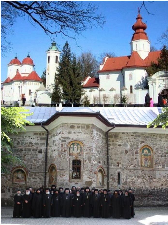
Slika 6: Manastir Bodrog izvana (gore) i izvorni dio iz 1177.g (dolje)