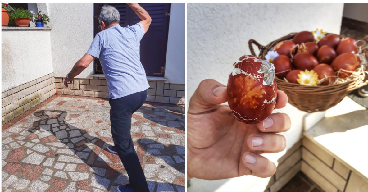
Slika 2. "Zadivanje jaja" u Dobranima za Vazan 2020.

Igra se drugačije naziva u raznim selima Istre. U Trvižu se igra zove hitat u jaje te se igra nakon mise na Uskrs ili na Uskrsni ponedjeljak. Zatim u Kaldiru se govorilo gremo boćat jaja , a znali su ih i ukrašavati vrpcom kako bi ih raspoznavali svoje od tuđeg jaja. Zatim bi odredili kojom kovanicom će gađati, danas je to većinom kovanica od 1, 2 ili 5 kuna. Ostali nazivi koji su korišteni u selima Istre jesu i ščukat jaje ili pićit jaje . 11 U mjestu stanovanja autorice rada, u Dobranima na Barbanštini, govori se gremo zadivati jaja i gađa se nakon uskršnjeg ručka.