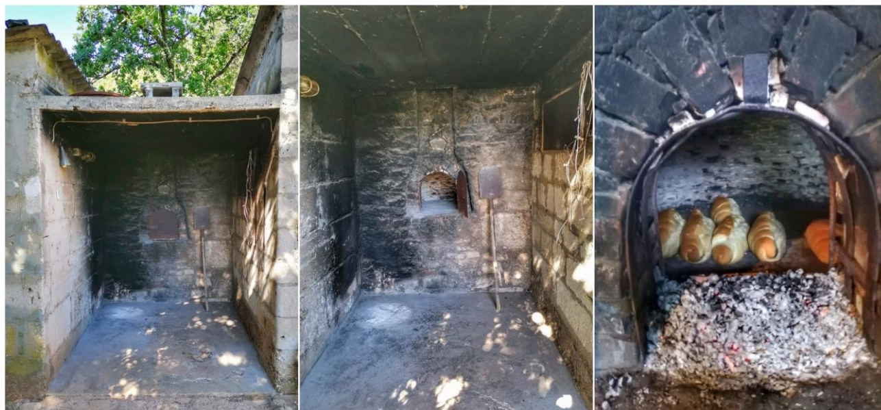
Slika 8. Krušna peć u selu Dobrani

se nalazile u dvorištima domaćinstava u razini dvorišta, prislunjene uz kuću ili neki drugi gospodarski objekt. Neke su krušne peći imale i nadstrešnicu koja je služila za zaštitu od lošeg vremena. Na pročeljima peći nalazila se često i kamena ploča koja je služila za odlaganje ispečenog kruha, a sam otvor peći zatvarao se ili kamenom pločom ili malim željeznim vratima. Unutrašnjost peći bila je obložena ciglama i u obliku volte. 41