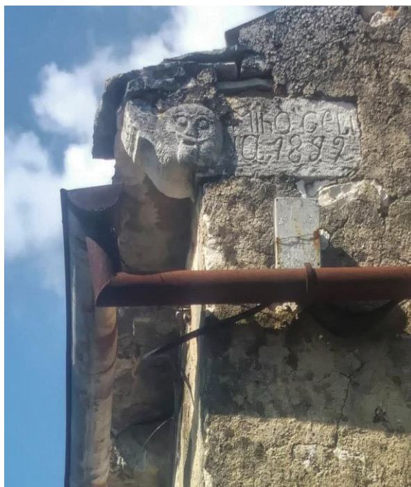
Slika 7. Kamena glava s natpisom u Beločima

Istarski su kamenoklesari dali značajan doprinos kulturi jer su klesali i glagoljske zapise u kamene spomenike, od kojih su neki i sačuvani. Od svih su spomenika najviše očuvani nadgrobni, na kojima nema teksta već znakova poput sjekire, noža ili motike, odnosno prikazano je ono čime se pokojnik bavio za života. Takvi su se spomenici izrađivali za bogatije seljake sela. U sljedećim razdobljima povijesti nastavio se trend obrade kamena, a barok je donio i klesanje ljudskih glava, od kojih se neke i danas nalaze na fasadama, ogradama, stupovima, a kojima je jedini cilj bio ukras. 40