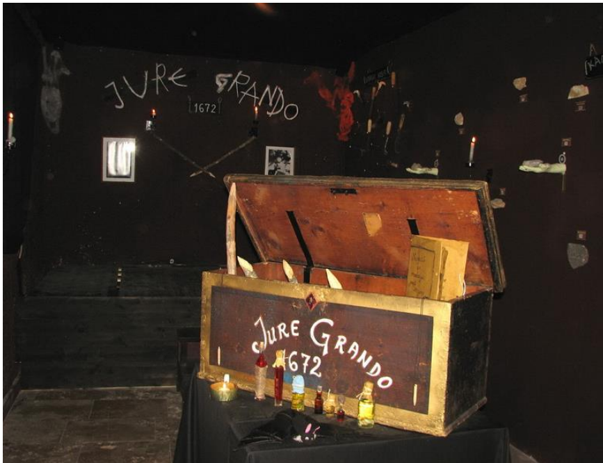
Slika 11. Unutrašnjost Muzeja vampira u Kringi