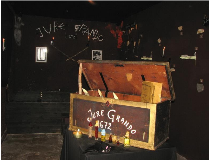
Slika 11. Unutrašnjost Muzeja vampira u Kringi