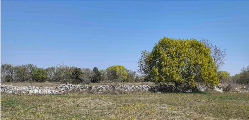
Slika 6. Granično kamenje/kunfin u Dobranima

Kamen se koristio i za ograđivanje polja, tj. bilo je to granično kamenje ili kunfin koji se nalazio između privatnih posjeda. 39