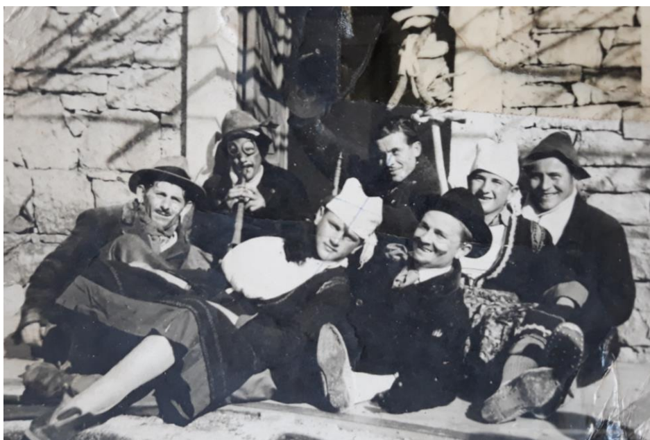
Slika 3. Maškare 1950-ih godina, Dobrani i Beloći