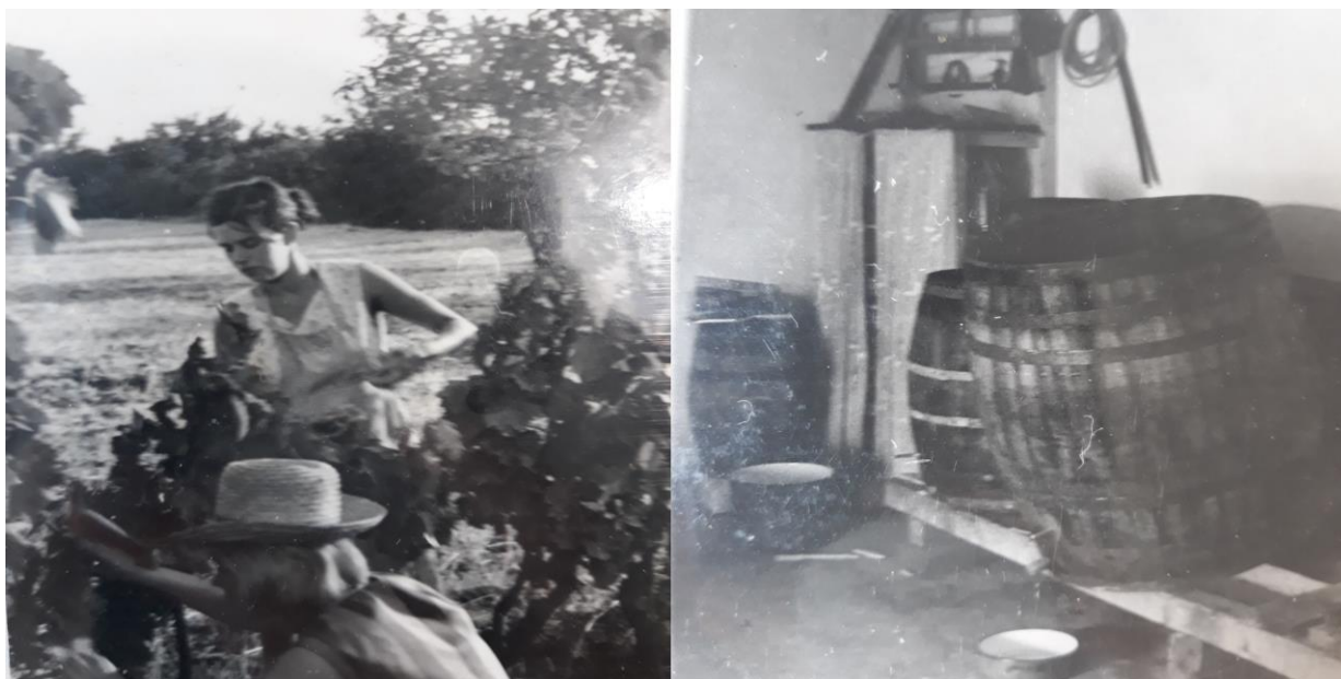
Slika 4. Trganje grožđa i drvene bačve 1960-ih u selu Dobrani