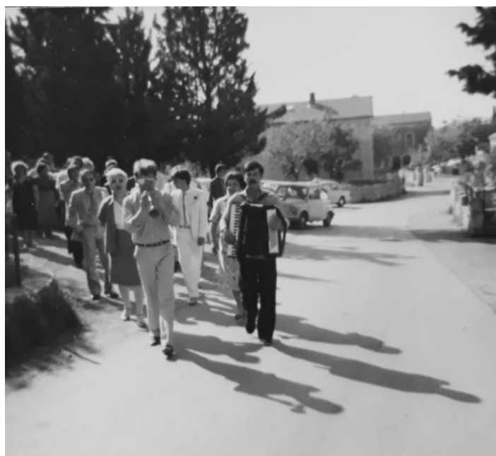
Slika 5. Svadbena povorka u Raklju 1984.

Svatovi su u Istri izgledali puno drugačije nego što izgledaju danas. Razlika se odmah uviđa i u samoj odjeći koju su mladenci nosili na vjenčanju – to je bila narodna nošnja. Zatim, sam broj uzvanika bio je oko 20, zbog velike neimaštine pa se nije mogla pripremati velika gozba za velike svatove kao danas. Ipak, roditelji mladenaca trudili su se što bolje pripremiti svatove kako ne bi nedostajalo hrane i piće zbog pitanja časti i ugleda. Osim gozbe, važna je bila i glazba pa su instrumenti koji su predvodili svatove bili zvukovi roženica, harmonike, miha i vijulina, a glavni ton bilo je pjevanje i sviranje na tanko i debelo. Slika koja je priložena u nastavku fotografirana je u Raklju 1984. prilikom odlaska po mladu, što je vremenski kasnije nego običaji koji su objašnjeni, no vidi se da su se određeni običaji zadržali – glazba je prva u svadbenoj povorci.