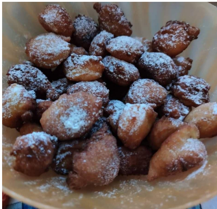
Slika 1. Fritule za Vazan, 2019.

Osim pince, pekla se je i jajarica – pletenica od tijesta koja je na svojem kraju imala jaje, a osim njih spremale su se i prije spomenute fritule. Fritule se spremaju od finog brašna te se u tijesto stavi kvasac, ulje, žumanjke i šećer. Nakon dugog miješanja tih sastojaka, smjesa se mora pustiti malo da odstoji, odnosno treba tijestu dati dovoljno vremena da se nadigne, a onda bi se žlicom uzimala smjesa i stavljala u kipuće ulje sve dok fritule ne požute. Posluživale su se, i još se poslužuju, posipane finim šećerom. 9