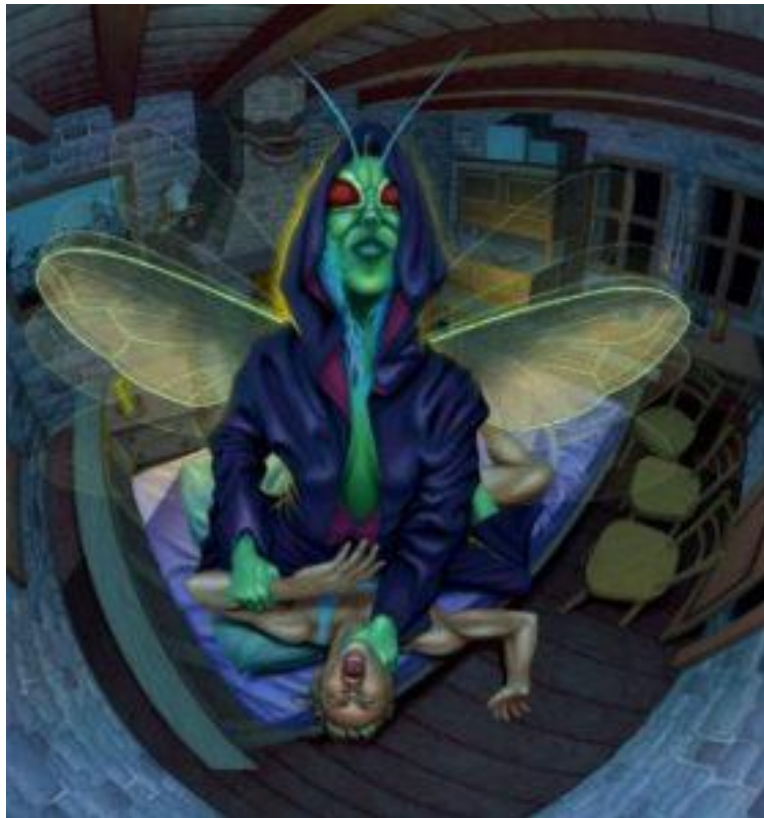
Slika 10. Ilustracija more za LegendFest 2017.