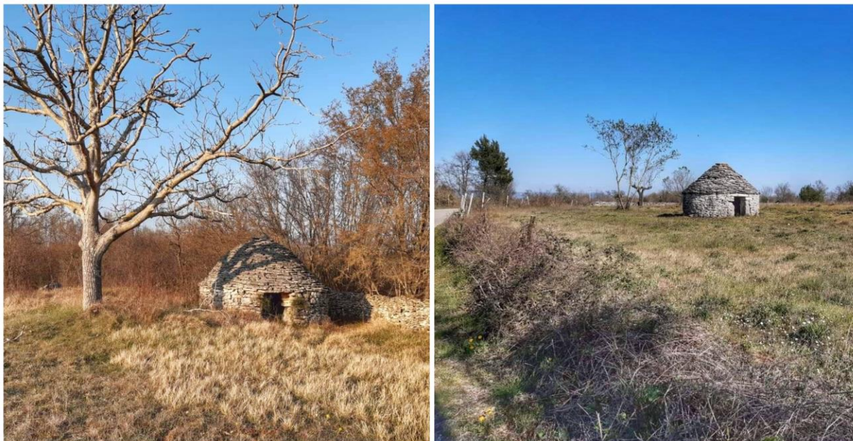
Slika 9. Kažun u Želiskima (lijevo) i u Filipani (desno)

i u zidovima koji su označavali granice privatnog posjeda i polja, a kažuni su bili izgrađeni duž takvih zidova, na njihovim spojevima (kažun u Želiskima) ili na uglu, no moguće ih je pronaći i na sredini livada (kažun u Filipani).