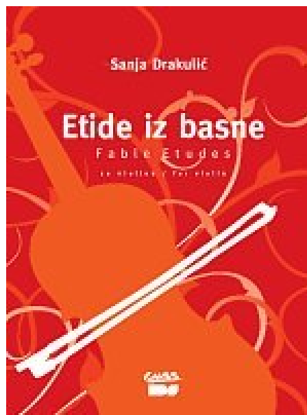
Slika 10: Naslovnica Etide iz basne

„Iako su etide pisane kao zadane skladbe, njihov život ne završava samim natjecanjima, već su ... instruktivni dio školskog programa... i mali biseri violinske literature. Bogatom invencijom i osjetljivošću za osnove violinskog sviranja, autorica nas vodi u čarobni svijet koji čine nadasve sretna kombinacija naizgled banalnih tehničkih problema, problema muzičkog izražavanja, imaginarnog svijeta i razumijevanja izričaja današnjega vremena“. Nenad Merle ( http://www.rockmark.hr/artikl/275/etide-iz-basne-za-violinu )