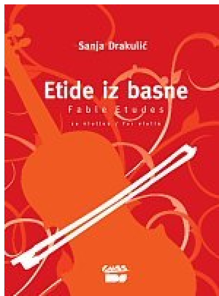
Slika 10: Naslovnica Etide iz basne

„Iako su etide pisane kao zadane skladbe, njihov život ne završava samim natjecanjima, već su ... instruktivni dio školskog programa... i mali biseri violinske literature. Bogatom invencijom i osjetljivošću za osnove violinskog sviranja, autorica nas vodi u čarobni svijet koji čine nadasve sretna kombinacija naizgled banalnih tehničkih problema, problema muzičkog izražavanja, imaginarnog svijeta i razumijevanja izričaja današnjega vremena“. Nenad Merle ( http://www.rockmark.hr/artikl/275/etide-iz-basne-za-violinu )