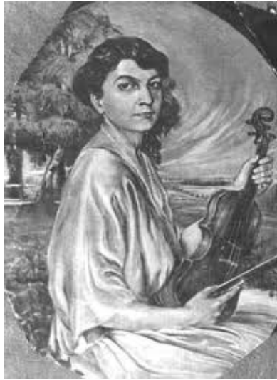
Slika 4: Dora Pejačević