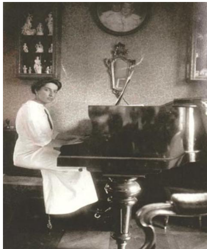
Slika 2: Dora Pejačević za klavirom, dvorac Pejačević, Našice, 1912.