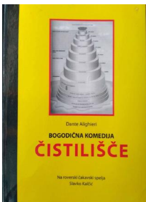
Illustrazione del secondo libro del poema Bogodična komedija di Slavko Kalčić intitolato Čistilišče , pubblicato nel 2011.