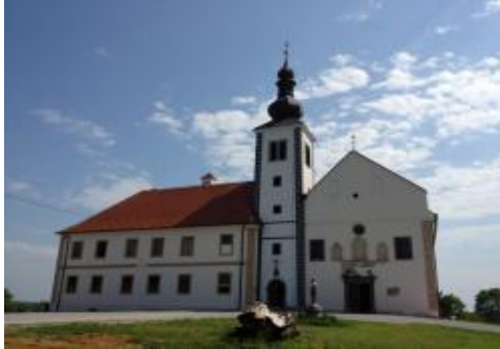
Slika 2. Crkva i samostan u Kamenskom