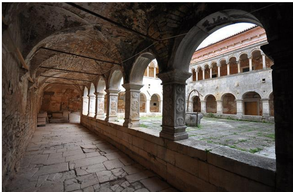
Slika 4. Klaustar samostana u Sv. Petru u Šumi