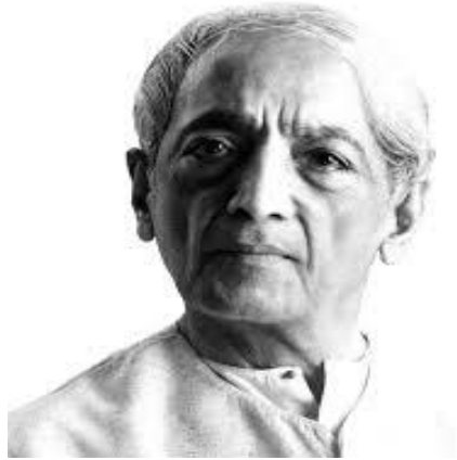
Slika 4. Jiddu Krishnamurti

https://bs.wikipedia.org/wiki/Jiddu_Krishnamurti