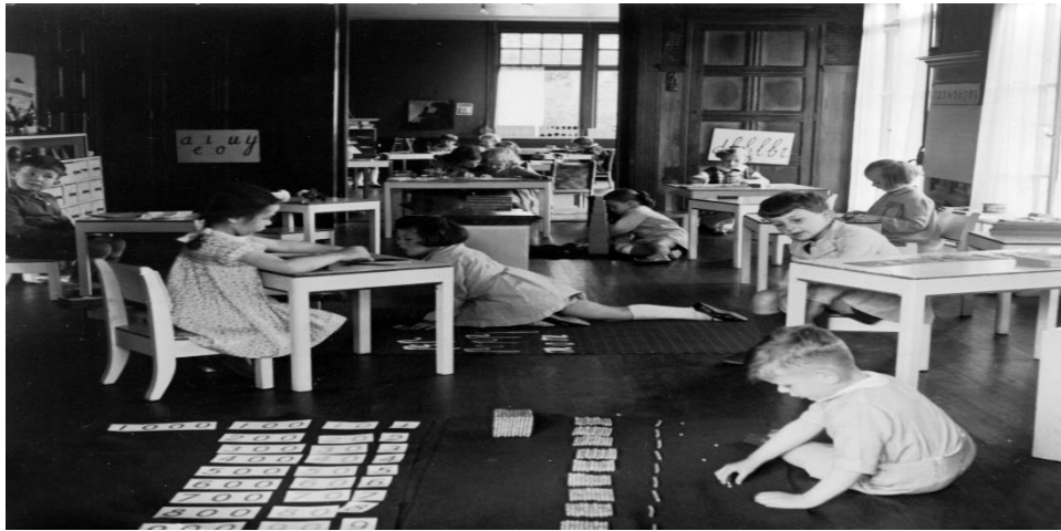
Slika 5. Počeci Montessori učionica

https://45conversations.com/history-of-montessori-method/