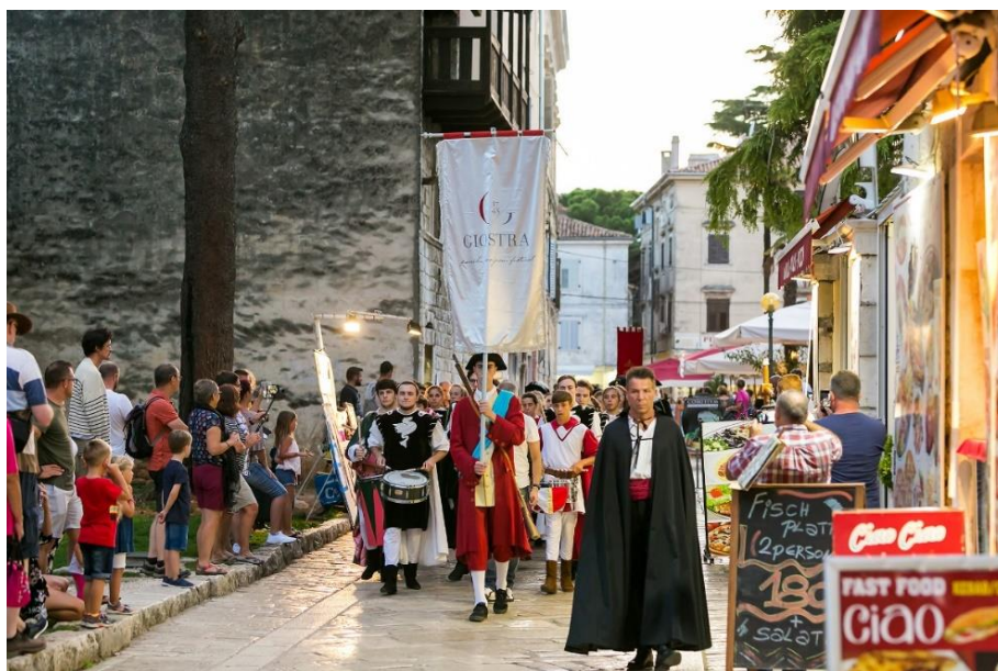
Slika 3. Giostra

Najpoznatija kulturna manifestacija koja predstavlja nematerijalnu baštinu Poreča je Giostra. Povijesni festival Giostra pokrenut je 2007. godine i to kao projekt zaštite nematerijalne kulturne baštine, ali i kao manifestacija koja obogaćuje turističko – kulturnu ponudu Poreča. Manifestacija je nastala u organizaciji Studia 053 iz Poreča, Turističke zajednice Grada Poreča te pod pokroviteljstvom Grada Poreča, a ulogu u osmišljavanju projekta imala je ravnateljica Zavičajnog muzeja Poreštine, Elena Uljančić. Prvi poznati podaci o Giostri datiraju iz 1672. godine kada je 8. svibnja na dan SV. Mihovila u Poreču organizirana svečanost Fiera franca triduana, trodnevni festival s natjecanjima u samostrelu, plesovima i pučkim igrama, a glavni događaj bila je viteška igra Giostra. Dokument u kojem se ova svečanost detaljno opisuje, a na kojem se ujedno i temelji današnja manifestacija, potječe iz 1745. godine. 52