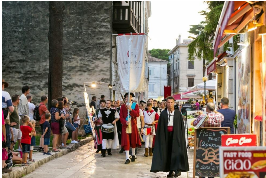
Slika 3. Giostra

Najpoznatija kulturna manifestacija koja predstavlja nematerijalnu baštinu Poreča je Giostra. Povijesni festival Giostra pokrenut je 2007. godine i to kao projekt zaštite nematerijalne kulturne baštine, ali i kao manifestacija koja obogaćuje turističko – kulturnu ponudu Poreča. Manifestacija je nastala u organizaciji Studia 053 iz Poreča, Turističke zajednice Grada Poreča te pod pokroviteljstvom Grada Poreča, a ulogu u osmišljavanju projekta imala je ravnateljica Zavičajnog muzeja Poreštine, Elena Uljančić. Prvi poznati podaci o Giostri datiraju iz 1672. godine kada je 8. svibnja na dan SV. Mihovila u Poreču organizirana svečanost Fiera franca triduana, trodnevni festival s natjecanjima u samostrelu, plesovima i pučkim igrama, a glavni događaj bila je viteška igra Giostra. Dokument u kojem se ova svečanost detaljno opisuje, a na kojem se ujedno i temelji današnja manifestacija, potječe iz 1745. godine. 52