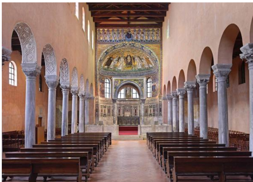
Slika 4. Unutrašnjost Eufrazijeve bazilike

Tlocrt bazilike predstavlja prostranu longitudinalnu građevinu s jednom širokom središnjom apsidom. S devet pari stupova prostor je podijeljen u tri broda. Prema Prelogu stupovi nose različite kapitele te imposte na kojima je u okruglom medaljonu uklesan monograf biskupa Eufrazija. S obzirom na različite veličine kapitela visina samih stupova nije jedinstvena, a isto tako variraju debljina i oblik imposta. 65