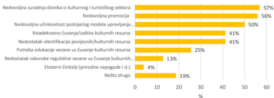
Tablica 1. Nedostaci u razvoju kulturnog turizma

U sljedećim tablicama prikazani su nedostaci i prioriteti u razvoju kulturnog turizma.