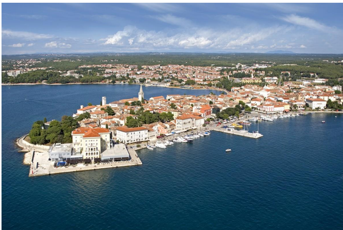
Slika 1. Grad Poreč - starogradska jezgra