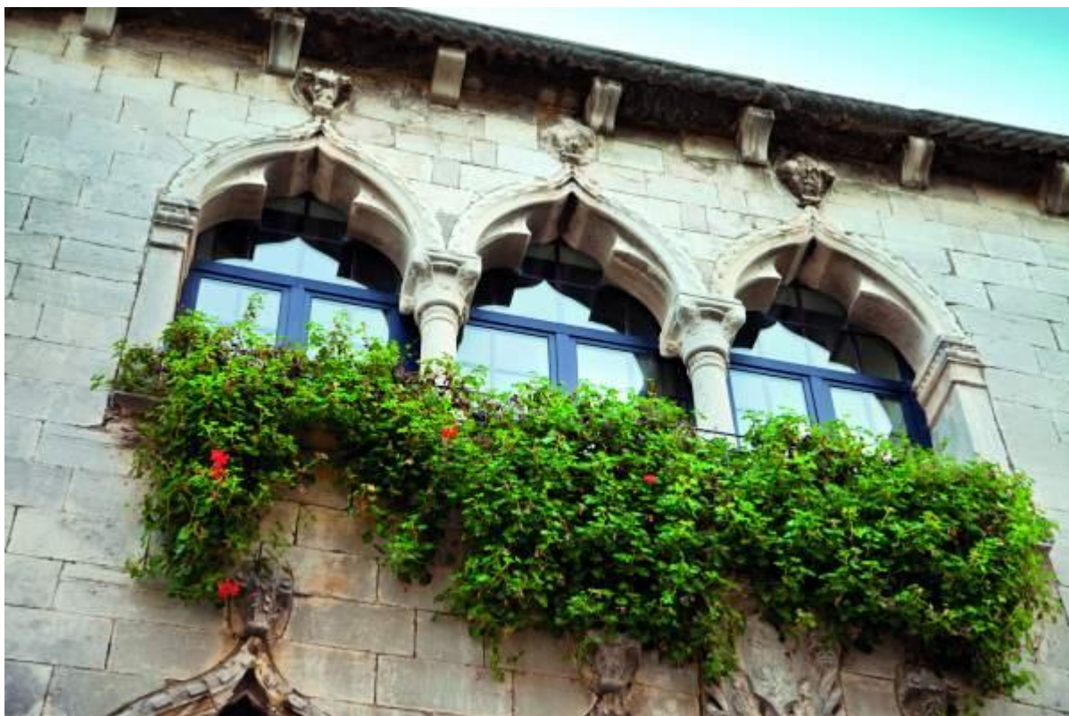
Slika 2. Gotička palača