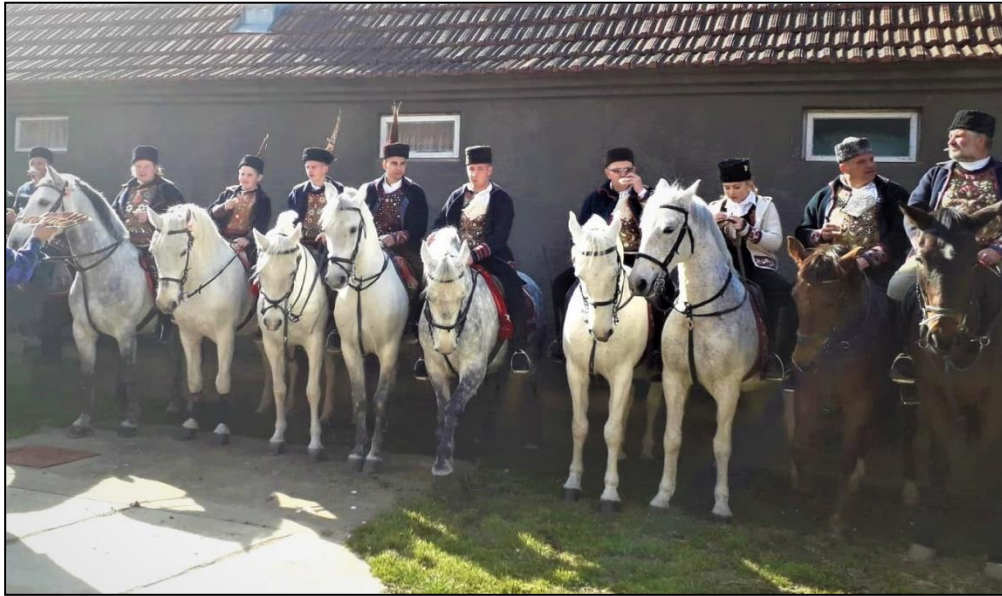
Slika 1. Pokladno jašenje u Komletincima, 27. veljače 2019.