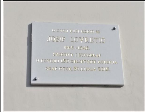
Slika 2. Poprsje i spomen-ploča Josipa Lovretića