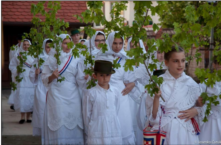
Slika 3. Ophod Filipovčica i VIII. smotra proljetnih običaja, 17. svibnja 2017.

napisala pjesmu povodom toga običaja pod nazivom Običaj je bio od starina . Pročitali bi tu pjesmu, a zatim bi s predsjednicom KUD-a Filipovčice i profesoricom glazbene kulture uvježbali pjesme koje pjevaju članovi KUD-a Filipovčice kada se slavi običaj filipovčice.