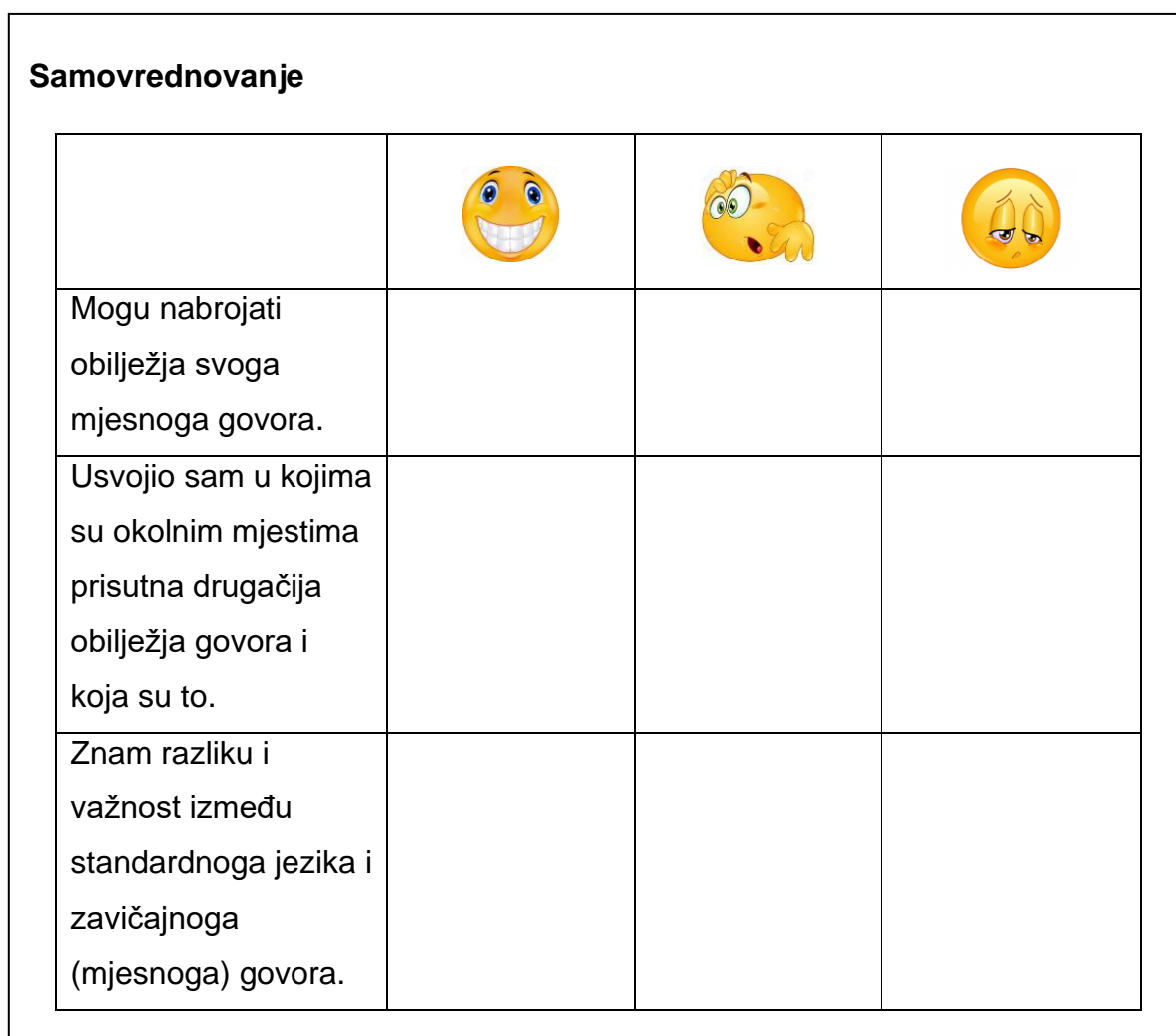
Tablica 1. Samovrednovanje znanja o zavičajnome (mjesnome) govoru

Početak prosinca učenici bi izložili svoje istraživanje o zavičajnome (mjesnome) govoru. Tijekom izlaganja opisali bi svoje mjesto, spomenuli bi s kojim su osobama vodili razgovor i predstavili ih u nekoliko rečenica, zatim bi izdvojili značajke svoga mjesnoga govora koje bi potkrijepili s primjerima koje su zapisali u nastavnome listiću i za kraj pustili bi kratku snimku razgovora da bi ostali učenici čuli kako se govori u pojedinome mjestu. Nakon što bi učenici završili s predstavljanjem mjesnih govora, profesorica bi učenicima podijelila tablice samovrednovanja. Tablica bi sadržavala elemente vrednovanja i kriterije vrednovanja. Učenici bi za svaki element vrednovanja procijenili koji kriteriji vrednovanja zaslužuju.