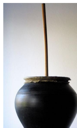
Slika 25. Lončani bas