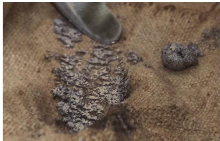
Slika 11. Priprema za završetak amalgamacije