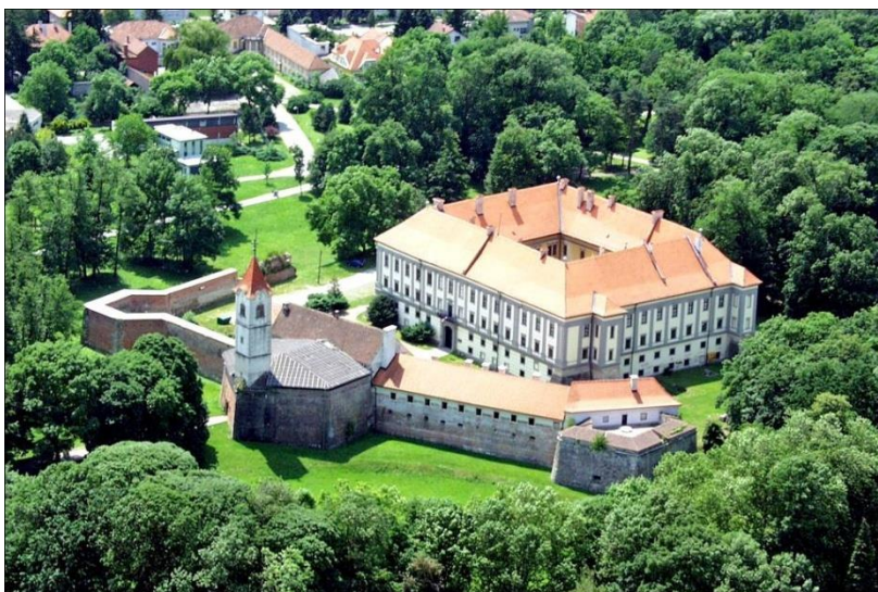
Slika 4. Dvorac Zrinski u Čakovcu

Možemo zaključiti da su Zrinski bili najmoćnija hrvatska plemićka obitelj koja je vladala Čakovcem i Međimurjem u 16. i 17. stoljeću. Branili su Hrvatsku od Turaka, ali i od prevlasti carske habsburške obitelji nad Hrvatskom. Poticali su kulturni život, proizvodnju i trgovinu te je za vrijeme Zrinskih Međimurje bilo veoma financijski moćno te razvijeno.