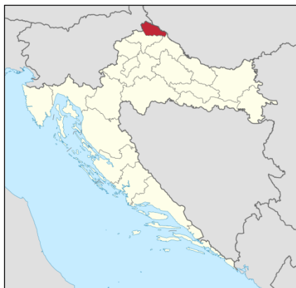
Slika 1. Geografski smještaj Međimurja

Gledajući kartu Međimurja, istočno od pruge Čakovec-Mursko Središće nalazi se Donje Međimurje, najplodniji dio naše županije. Razvijeno je stočarstvo, ratarstvo i u novije doba, industrija. Donje Međimurje imalo je mnogo problema i opasnosti od poplava, pošto su to najniži dijelovi uz rijeke Muru i Dravu, međutim najnovijim tehnologijama te radovima protiv poplava, ta opasnost gotovo da je nestala. Sama gustoća naseljenosti te broj naselja Donje Međimurje svrstava kao vodeći kraj, ne samo u Međimurskoj županiji, već i u Republici Hrvatskoj.