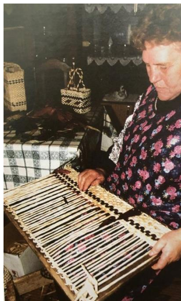
Slika 8. Druga faza pletenja