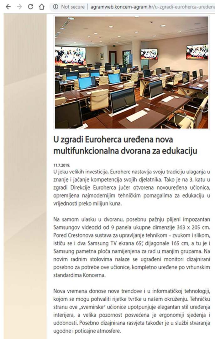
Slika 4. Obavijest o otvaranju nove učionice