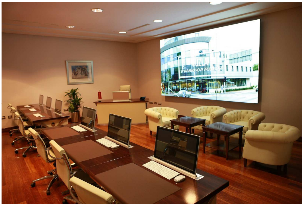
Slika 8: Edukacijska učionica Zagreb