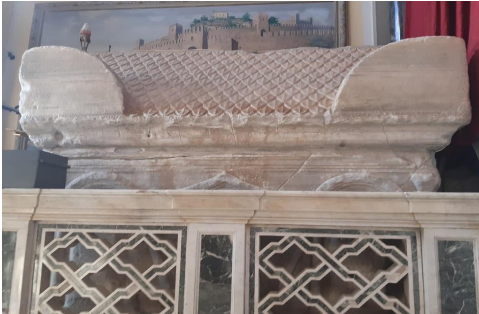
SLIKA 2: Sarkofag u kojem se nalazi tijelo svete Eufemije.

svetice. Sarkofag je fascinirao djecu te su željela saznati više informacija o veličini, načinu izrade, materijalu, ukrasima i slično.