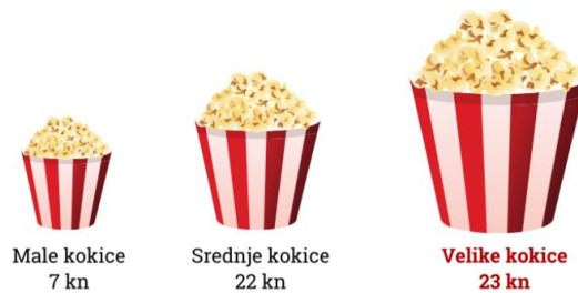
Slika 3: Efekt ružnog pačeta

Ideja ove strategije je da budu ponuđene tri verzije sličnog ili istog proizvoda. Npr. Idete u kino i možete izabrati između dvije veličine kokica. Male kokice koštaju 7 kn, a velike 23. Svi bi odabrali male jer su velike dosta skuplje, ali ako se u ponudi pojave srednje kokice za 22 kn? Većina će odabrati velike jer su samo kunu skuplje od srednjih. To znači da smo upravo pali u zamku ružnog pačeta.