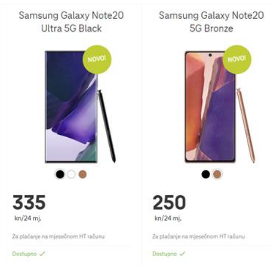
Slika 1: Prvi proizvod je uvijek skuplji