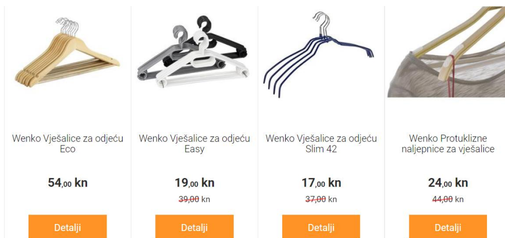
Slika 4: Srednja opcija je najbolja

Ova taktika se zasniva na tome da nam intuicija nalaže da je najbolji izbor uvijek onaj u sredini. Nije ni preskup, ni prejeftin. Potrošač zna da ne želi najjeftiniju verziju, niti želi trošiti novac na luksuz, pa se odlučuje za srednju verziju. Ova taktika se vrlo često koristi i kod povezivanja proizvoda. U donjem primjeru vidimo da su ponuđene 3 vrste vješalica, skuplje, srednje i jeftine. Jeftine su prejeftine i vidi se da su lošije kvalitete, skuplje su preskupe tako da je najbolja opcija srednja visina cijene.