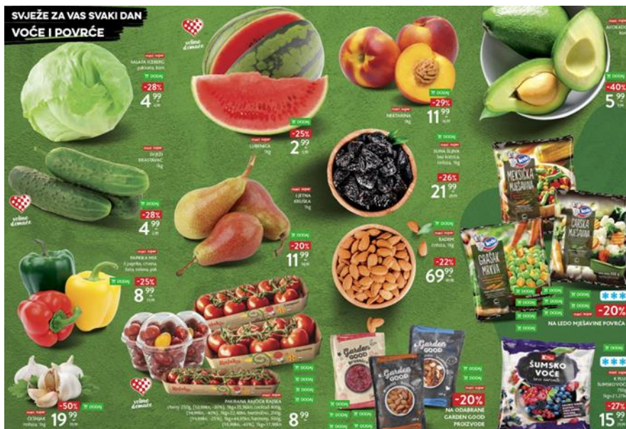
Slika 2: Cijene s brojem 9