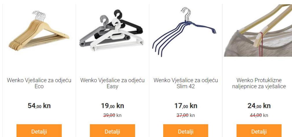
Slika 4: Srednja opcija je najbolja

Ova taktika se zasniva na tome da nam intuicija nalaže da je najbolji izbor uvijek onaj u sredini. Nije ni preskup, ni prejeftin. Potrošač zna da ne želi najjeftiniju verziju, niti želi trošiti novac na luksuz, pa se odlučuje za srednju verziju. Ova taktika se vrlo često koristi i kod povezivanja proizvoda. U donjem primjeru vidimo da su ponuđene 3 vrste vješalica, skuplje, srednje i jeftine. Jeftine su prejeftine i vidi se da su lošije kvalitete, skuplje su preskupe tako da je najbolja opcija srednja visina cijene.