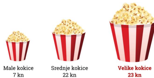
Slika 3: Efekt ružnog pačeta

Ideja ove strategije je da budu ponuđene tri verzije sličnog ili istog proizvoda. Npr. Idete u kino i možete izabrati između dvije veličine kokica. Male kokice koštaju 7 kn, a velike 23. Svi bi odabrali male jer su velike dosta skuplje, ali ako se u ponudi pojave srednje kokice za 22 kn? Većina će odabrati velike jer su samo kunu skuplje od srednjih. To znači da smo upravo pali u zamku ružnog pačeta.