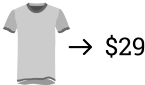
Slika 5: Otkrivanje cijene u pravo vrijeme

Ovdje se radi o online prodaji, kada su slike proizvoda prikazane prve, kupci svoje odluke temelje prema kvaliteti proizvoda i njihovom ukusu, a ako su cijene prikazane prve, kupci svoje odluke temelje na ekonomskoj isplativosti da li je taj proizvod vrijedan toliko koliko piše da košta. Kod prodaje luksuznih proizvoda kupci temelje svoju odluku prema kvaliteti proizvoda, zato je potrebno prvo prikazati proizvod, a zatim cijenu.