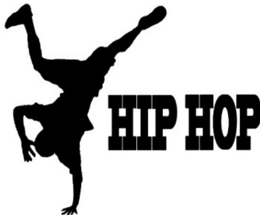
Slika 8. Hip Hop

Možemo reći da je hip hop izvrstan vid mentalnog i fizičkog vježbanja – učenje novih plesnih figura zahtijeva korištenje raznih grupa mišića, a stimulira i um i tijelo – napor koji se ulaže u učenje novih pokreta te slaganje kombinacija i pamćenje cijelih plesnih rutina omogućuje svakome vrhunsku mentalnu i fizičku vježbu ( https://pcz.hr/hip-hop-je-najintenzivnija-vrsta-plesa/ 27 ).