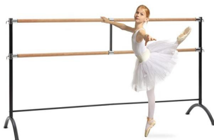
Slika 5. Balet