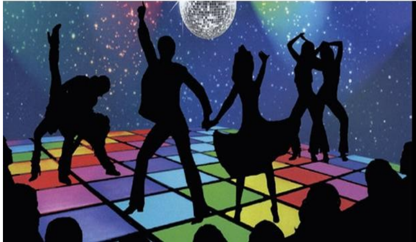
Slika 13. Disco dance