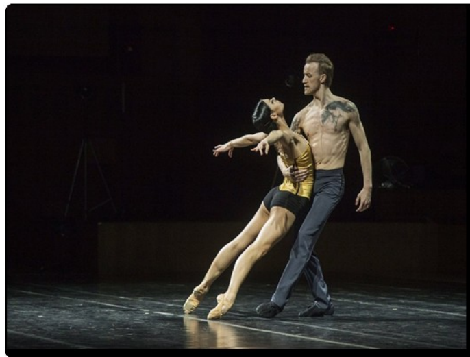
Slika 14. Moderni balet