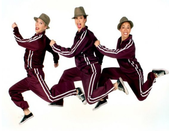
Slika 10. Show dance

scenografija, kao i tehnika, umjetničke vrijednosti i ekspresija natjecatelja su značajni u ocjenjivanju ovih nastupa ( https://hsps.hr/wp-content/uploads/2018/01/Prilog-3-NP-Pravilnik-plesnih-disciplina-i-stilova-HSPS-a-1.pdf ).