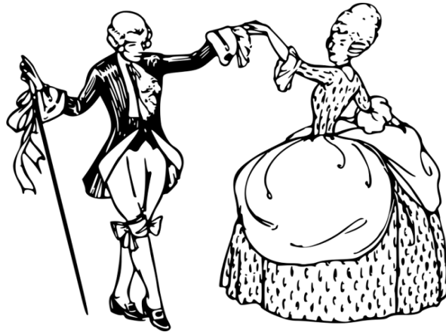
Slika 4. Valcer

Društveni plesovi su uglavnom nastali od narodnih igara slobodnim izražavanjem, pokretima i kretanjima koji su se prilagodili novim komunikacijama, novim načinima ponašanja i odijevanja. Svoj najburniji razvoj doživjeli su za vrijeme renesanse, kao dvorski plesovi visokog staleža. Među poznatije društvene plesove danas ubrajamo valcer (Slika br. 4) i polku.