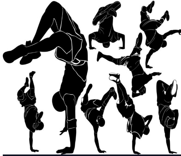
Slika 11. Break dance