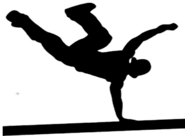
Slika 9. Street dance

To je kombinacija svih vrsta plesova poput breakdance-a, hip-hop-a i urbanog plesa. Ono što plesače čini posebnima je to da žive sportski, da se druže u zdravlju i prijateljstvu i da razmjenjuju iskustva s drugim vježbačima iz potpuno drugih gradova diljem zemlje ( www.dnf.hr/street-dance/ ).