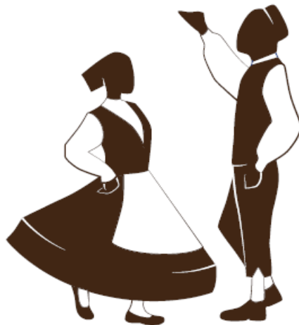
Slika 3. Istarski balun

Kao jedan od primjera narodnih plesova možemo navesti naš Istarski balun koji je prikazan na Slici broj 3: