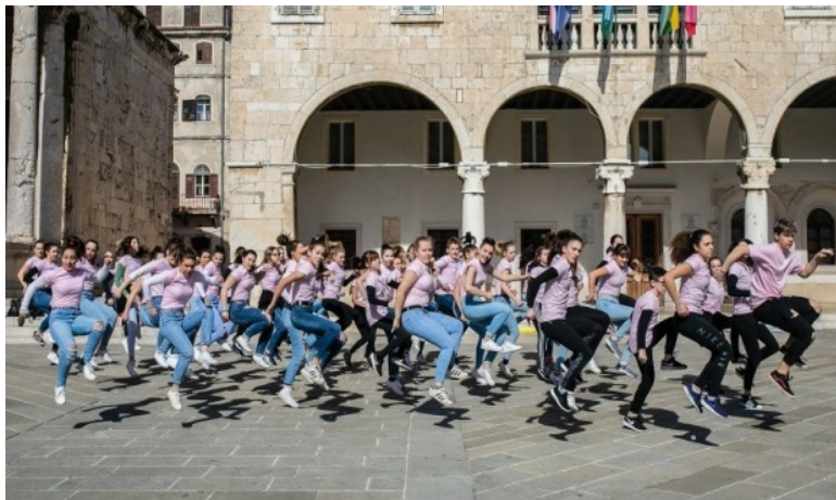
Slika 2. Obilježavanje svjetskog dana plesa u Puli 2019.

U Hrvatskoj se Svjetski dan plesa obilježava od 1999. godine. U Požegi se održava "Plesokaz", manifestacija različitih plesnih koreografija na kojoj vrsni plesači iz cijele Hrvatske pokazuje svoje umijeće. Osim što se za Međunarodni dan plesa predstavljaju profesionalni plesači koji plešu isključivo suvremeni ples, ova je manifestacija zanimljiva široj publici. Na slici br. 2 vidimo obilježavanje tog dana na Pulskom Forumu.