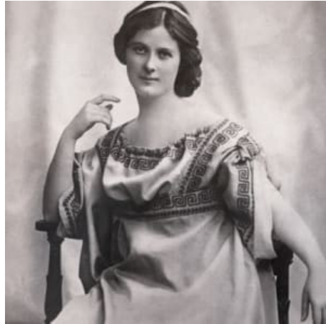
Slika 6. Isadora Duncan

velike plesačice iz prve polovice 20. stoljeća koja je zauvijek promijenila odnos publike prema baletu, ispunjena je njenom obnaženosti i prosovjetskim plesnim projektima, slobodnim odnosom prema ljubavi, sklonosti prema nekonvencionalnom oblačenju te krajnje neuobičajenim životnim stilom koji je šokirao publiku toga doba.