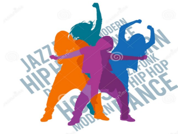
Slika 1. Moderni plesovi