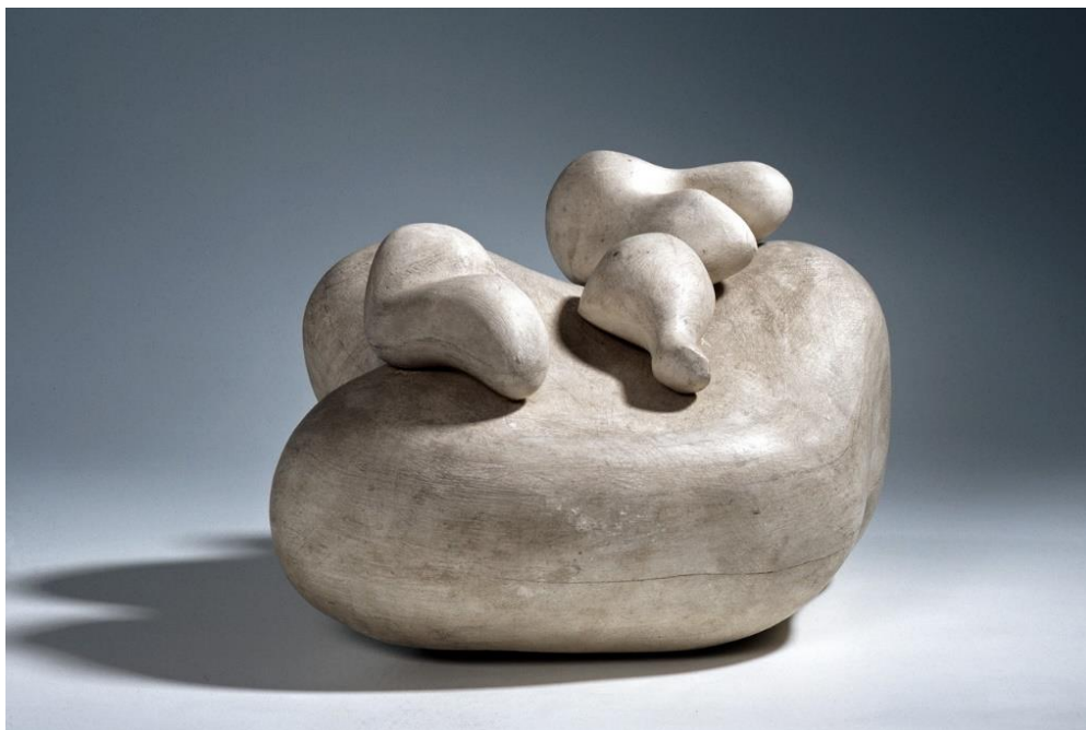
Slika 1. Glava s tri dosadna objekta. Bronca, 1930. (lijevano 1950.)

Veliki pomak u skulpturi dogodio se početkom tridesetih godina, jer se Arp posvetio glinenim i gipsanim modelima, a kasnije brončanim ili mramornim skulpturama. Važno je istaknuti da je utjecao na poznate kipare, kao što su bili: Henry Moore, Barbara Hepworth i Alexander Calder. (Arnason, 2009.)