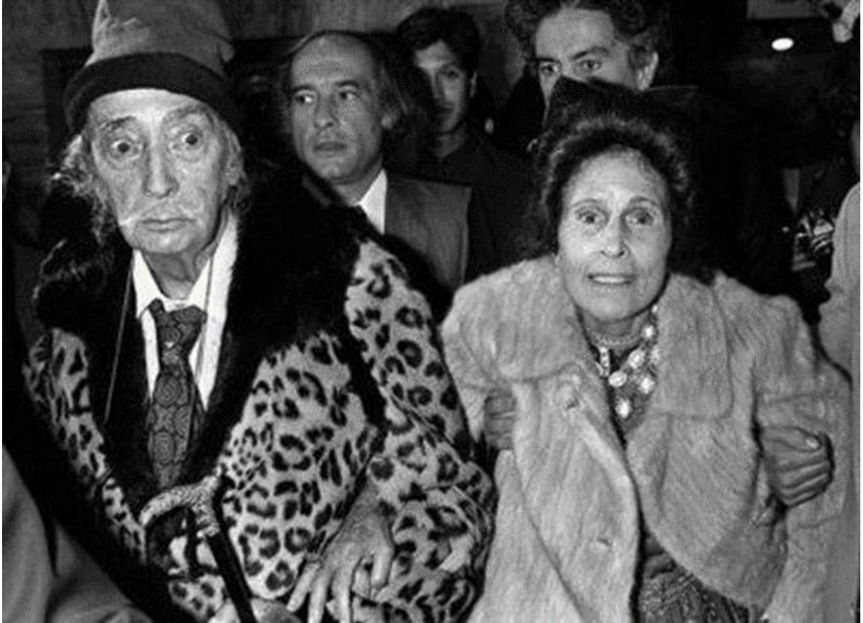
Slika 9. Salvador Dali i Gala