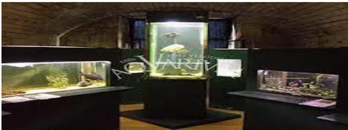
Slika 11. Aquarium Pula

Fort je 1947. preuzeo grad Pula i predao na korištenje lokalnom turističkom poduzeću. U njemu je bio smješten disko, frizerski salon, suvenirnice, trgovina, da bi kasnih 80-ih godina postao spalionica smeća. U stanju potpune zapuštenosti 2002. preuzela ga je biologinja i oceanologinja dr. Milena Mičić koja je vlastitim sredstvima krenula u postupnu revitalizaciju utvrde da bi u njoj otvorila Akvarij s referentnim centrom za liječenje morskih kornjača te školom biologije koju pohađaju mnogobrojna djeca. Da bi osigurala sredstva za početno čišćenje i postupno uređenje utvrde podigla je kredit stavljajući pod hipoteku vlastitu imovinu. Koliku potporu ima u tom projektu ilustrira podatak da je u posljednjoj raspodjeli Ministarstva kulture dobila 30 tisuća kuna, a procjenjuje se da bi samo za izradu projektne dokumentacije obnove cjelokupne utvrde trebalo 400 tisuća kuna, dok su za obnovu samu potrebni milijunski iznosi. Na raspolaganju za tako velike investicijske zahvate stoje mnogobrojni fondovi Europske unije, ali za to je potrebno imati čiste vlasničke odnose i pripremljenu konzervatorsku i projektnu dokumentaciju obnove. Bez tog preduvjeta ne može se sastaviti ni prijavnica, a realnost je takva da dio građevina čak nije ucrtan u katastarske planove. 38