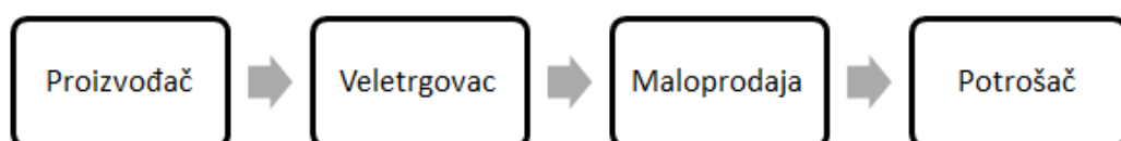
Slika 1. Primjer kanala distribucije namijenjenog razmjeni na tržištu krajnje potrošnje