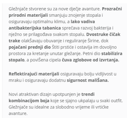
Slika 5. Primjer SEO optimizacije - opis proizvoda na web shopu