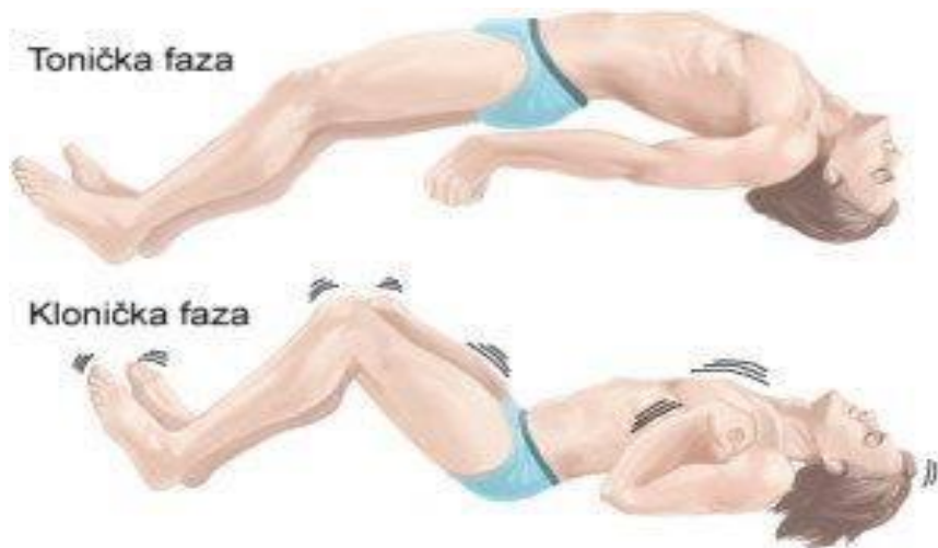
Prikaz toničke i kloničke faze tijekom eklamptičkog napadaja