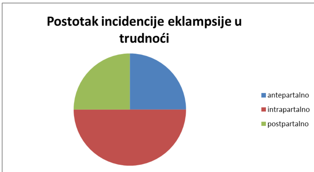
Grafikon 1. Postotak incidencije eklampsije u trudnoći (Habek, 2017).

Eklampsija se najčešće pojavljuje intrapartalno u 50% slučajeva, u 25% slučajeva pojavljuje se postpartalno i antepartalno se pojavljuje u 25% slučajeva (Habek, 2017).