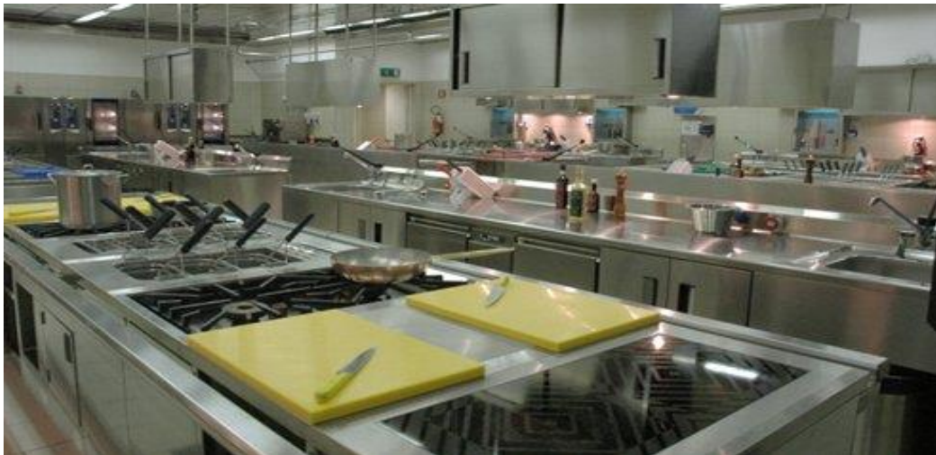
Slika 2: Prostorija za pripremu namirnica