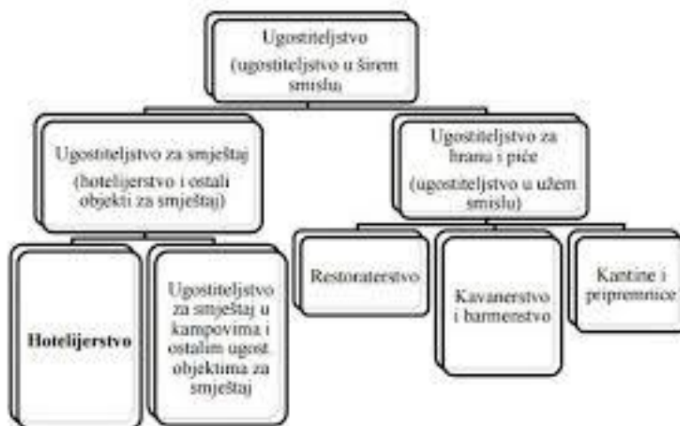
Slika 1: Gospodarska djelatnost ugostiteljstva u širem smislu