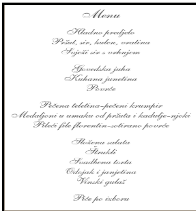
Slika 3: Primjer vrlo bogatog menija za svečanu prigodu