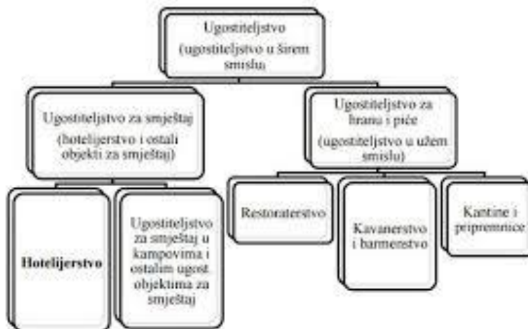
Slika 1: Gospodarska djelatnost ugostiteljstva u širem smislu