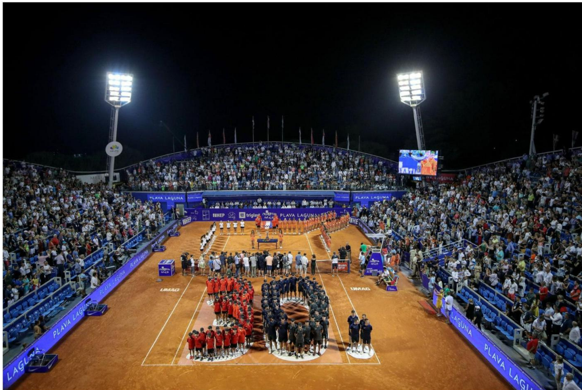
Slika 3. ATP turnir u Umagu