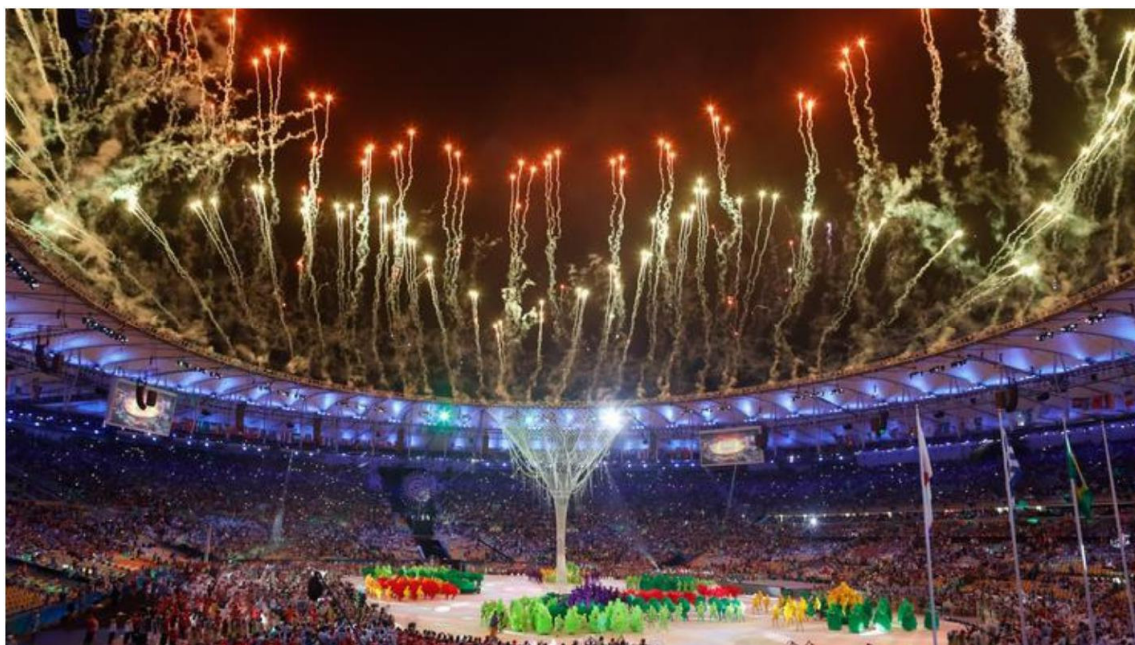
Slika 2. Prikaz Olimpijskih igara u Rio de Janeiru 2016. godine

Izvor: Hrvatski olimpijski odbor (2016): Sve hrvatske medalje, dostupno na https://www.hoo.hr/hr/natjecanja/olimpijske-igre/olimpijske-igre/oi-rio-2016/4440-oi-rio-sve-hrvatske-medalje-20-kolovoza , pristupljeno 31.08.2020.