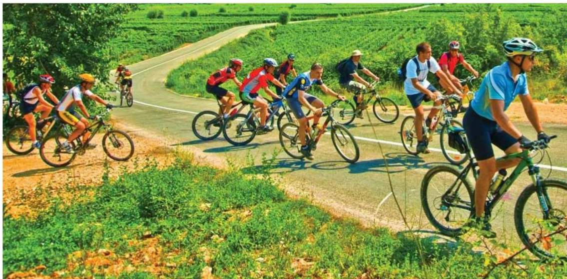
Slika 1. Prikaz turističke biciklijade