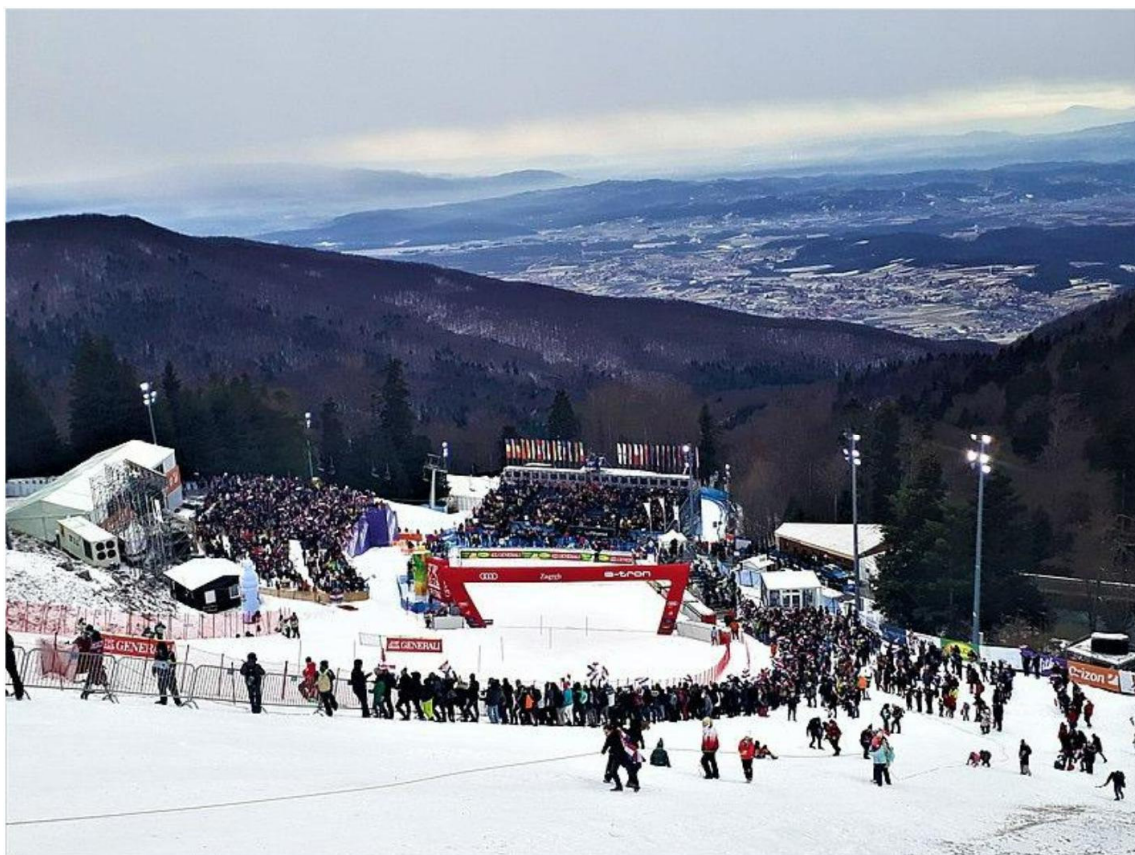
Slika 4. Snježna kraljica - slalomska utrka