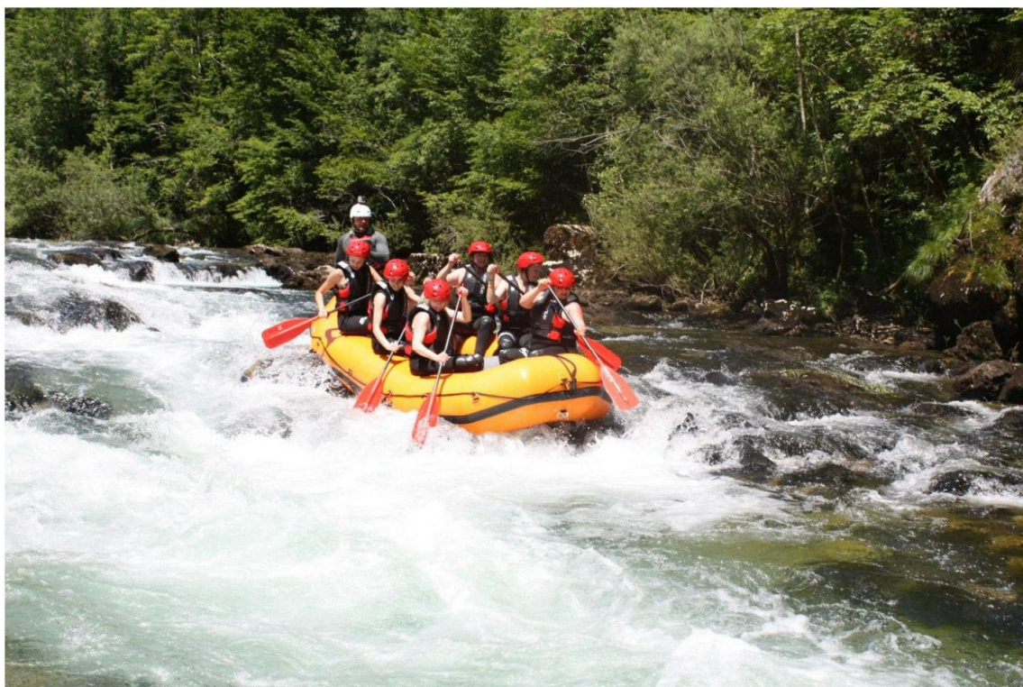
Slika 5. Rafting na rijeci Kupi