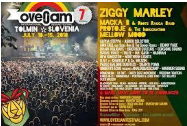
Fotografija 3. Supkulturni festival reggae glazbe u Tolminu Izvor: https://www.reggaeville.com/dates/festival-details/ , (06.06.2020.)