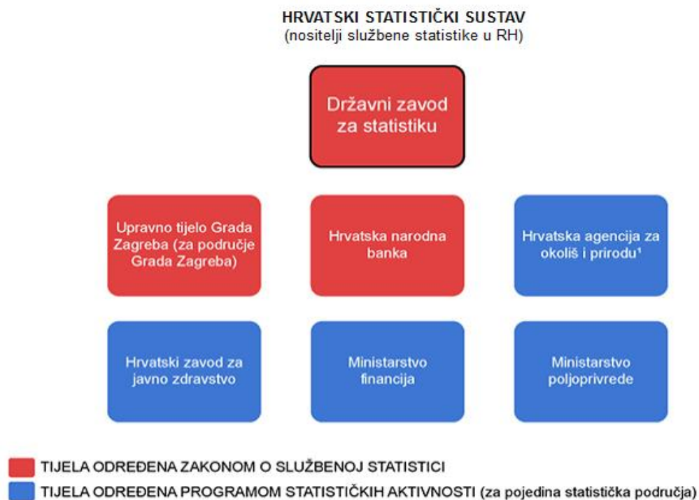
Slika 2. Hrvatski statistički sustav