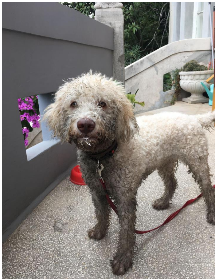
Fotografija 2: *Lagotto Romagnolo nakon sakupljanja tartufa

Skupljanje tartufa i njihova prodaja imaju veliku važnost na globalnoj razini jer je ova vrsta gljiva prepoznata kao vrlo važan proizvod, s obzirom na to da se njihovim sakupljanjem, a najviše prodajom ostvaruju direktne ekonomske beneficije te su vrlo bitan segment turističke i gastronomske ponude, kao i promocije određenih turističkih područja poput Motovuna i Buzeta. Tartufe zapravo ne sakupljaju ljudi, već njihovi psi. Pasma Lagotto Romagnolo* (također zvana romanjanski pas za vodu) ključna je za sakupljanje tartufa, s obzirom da su uzgojeni na način da se vode njuhom te im je u instinkte usađena želja za kopanjem i traženjem gljiva, zbog toga ih se naziva psima tartufarima.