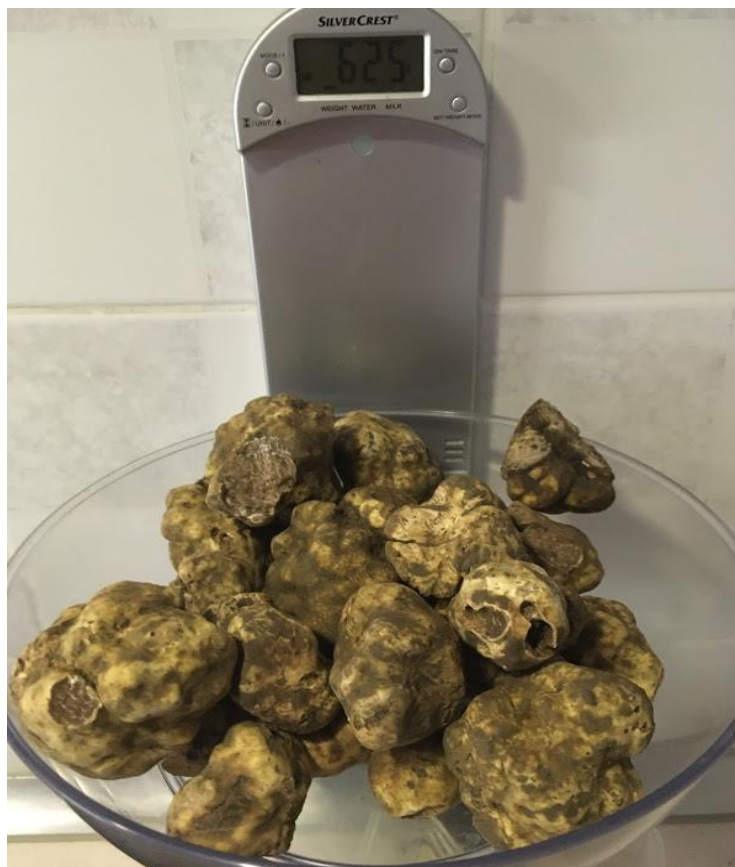
Fotografija 1: *Tuber Magnatum Pico, bijeli tartuf

Na svijetu postoji preko 180 vrsta tartufa, dok je u Hrvatskoj prisutno samo nekoliko desetaka vrsta. Tartufi se mogu razlikovati prema boji, obilježjima površine, boji i vrsti unutarnjeg tkiva te obliku i veličini spora gljive. Tartufi se općenito dijele prema boji kože na bijele i crne tartufe. 5 Neke od najtraženijih vrsta tartufa koje se mogu naći u Hrvatskoj su veliki bijeli tartuf ( Tuber Magnatum Pico )* poznat kao najskuplji i najtraženiji među svim tartufima te najekskluzivnija jestiva gljiva na svijetu, zatim crni zimski tartuf ( Tuber Melanosporum ) koji je najčešći te ga ima najviše, crni ljetni tartuf ( Tuber Aestivium ), tamni ljetni tartuf ( Tuber Uncinatum ) te zimski tartuf ( Tuber Brumale ). 6