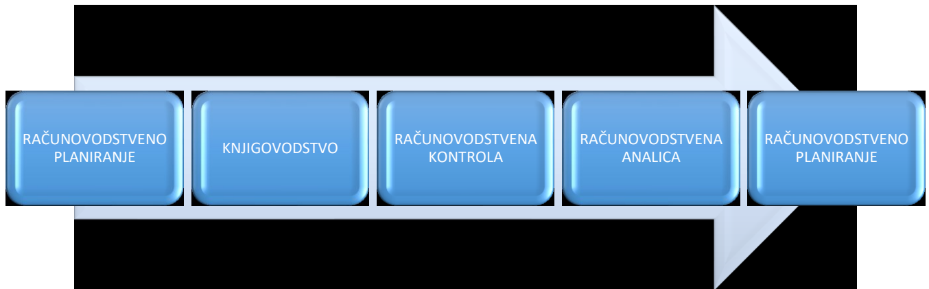
Slika 2. Tradicionalna struktura računovodstva