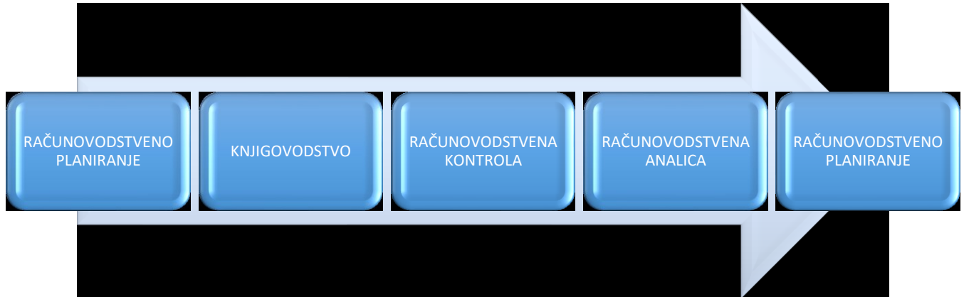
Slika 2. Tradicionalna struktura računovodstva