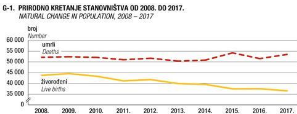
Slika 1.: Prirodno kretanje stanovništva RH od 2008-2017.godine

Izvor: DZS (2017.), Prirodno kretanje stanovništva RH od 2008-2017. Godine, Državni zavod za statistiku. Zagreb: https://www.dzs.hr/Hrv_Eng/publication/2018/07-01-01_01_2018.htm , (05.08.2018)