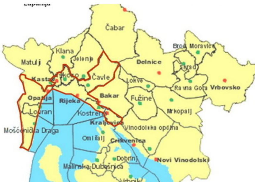
Slika 15. Prikaz urbane aglomeracije Rijeka