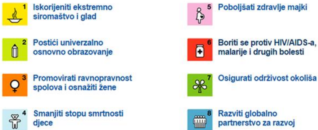
Slika 3. Osam glavnih ciljeva „Milenijske deklaracije“