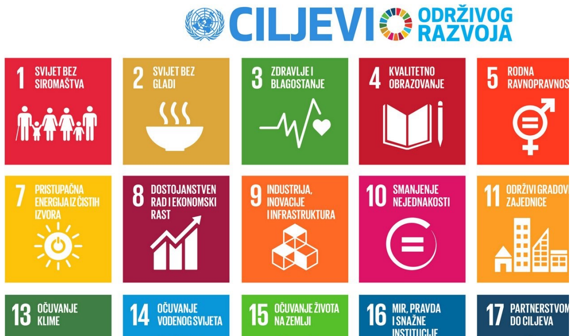
Slika 4. Ciljevi Programa za održivi razvoj 2030

Izvor : Ministarstvo zaštite okoliša i energetike (2018): Ciljevi programa za održivi razvoj 2030, dostupno na www.mzoip.hr , pristupljeno 17.07.2018.