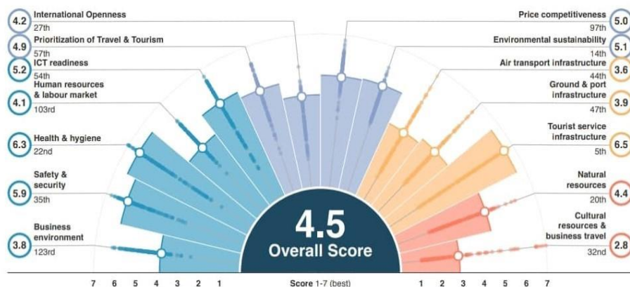
Slika 3. Pozicija Hrvatske prema Izvješću o konkurentnosti putovanja i turizma, 2019. godine