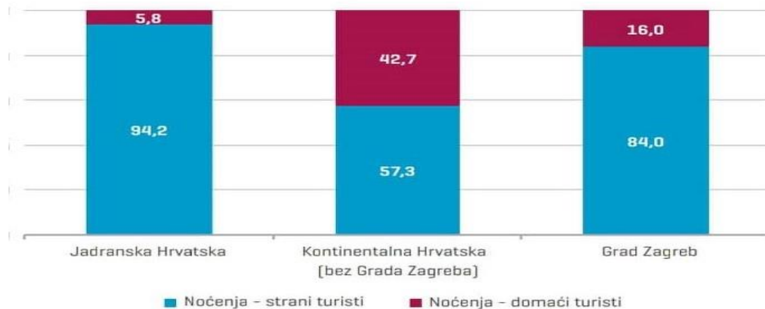
Grafikon 1. Stopa rasta noćenja prema regijama Hrvatske za 2017. godinu