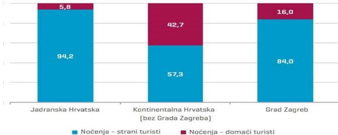
Grafikon 1. Stopa rasta noćenja prema regijama Hrvatske za 2017. godinu