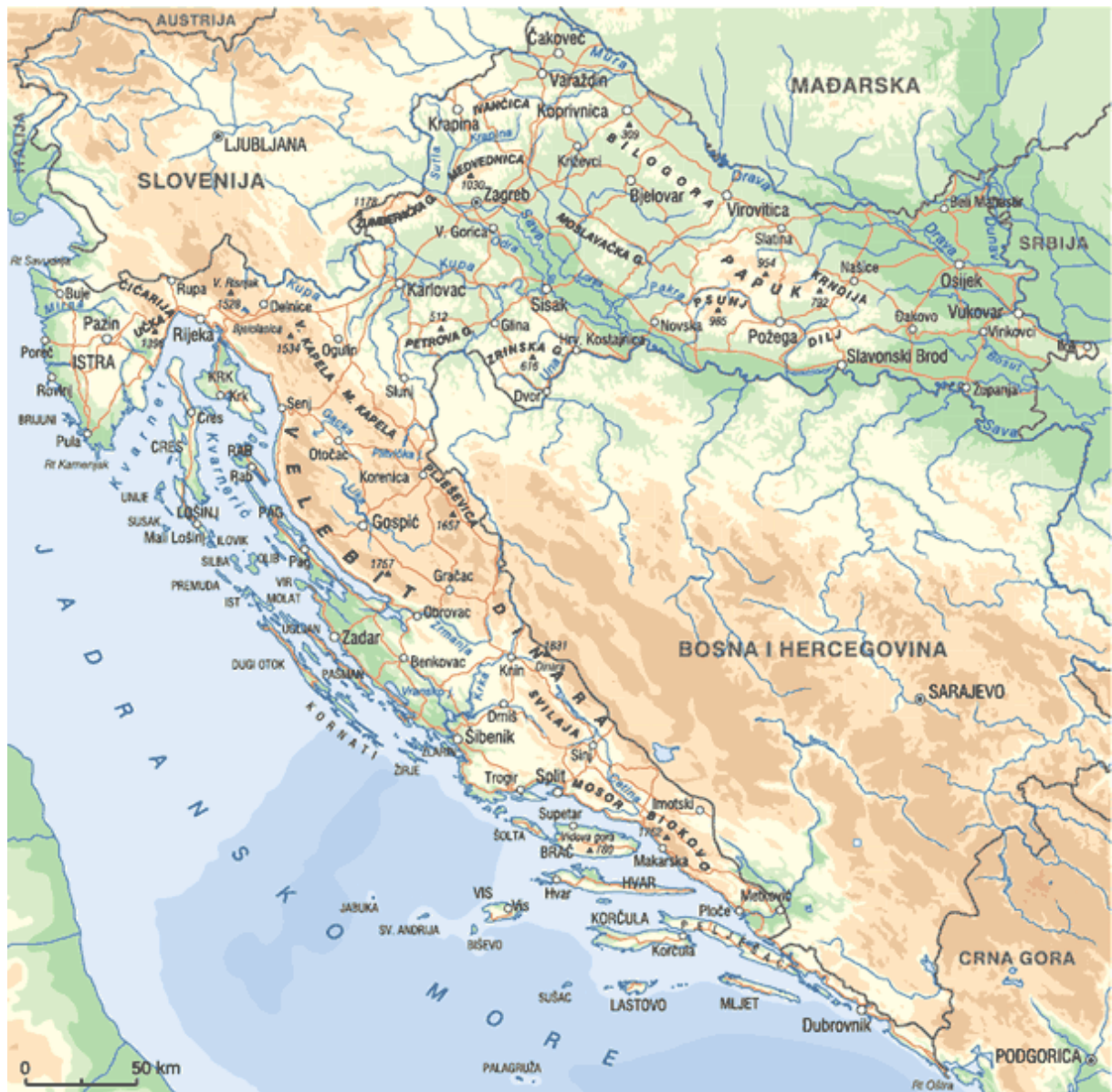
Slika 1. Karta Republike Hrvatske