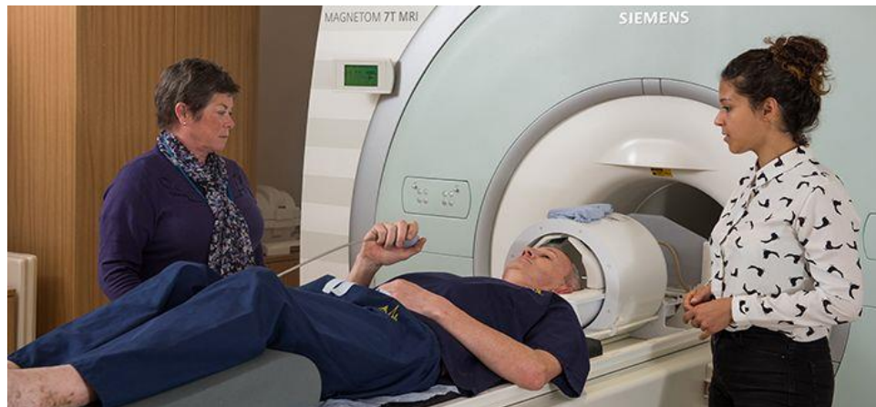
Slika 2. fMRI uređaj