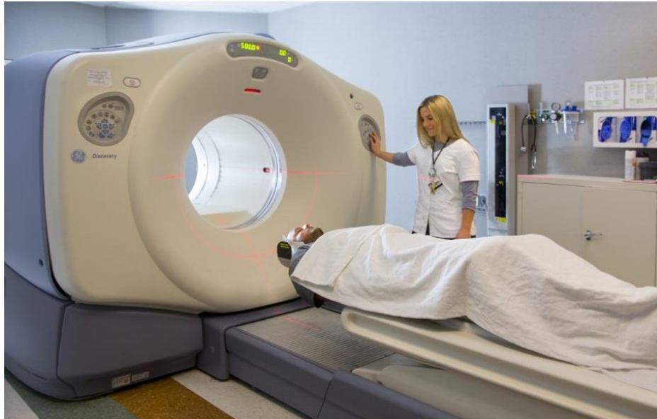
Slika 3: PET uređaj