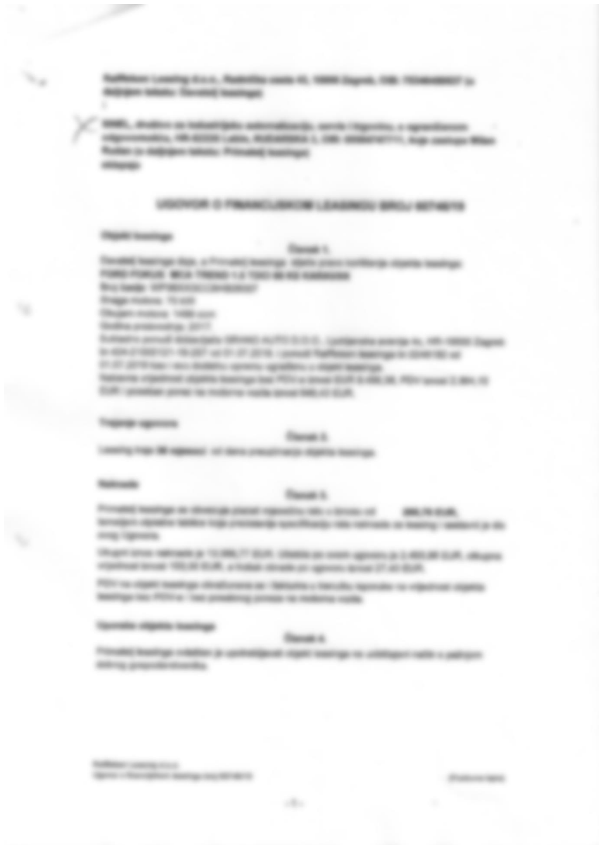
Slika 6. Ugovor o financijskom leasingu s otplatnom tablicom