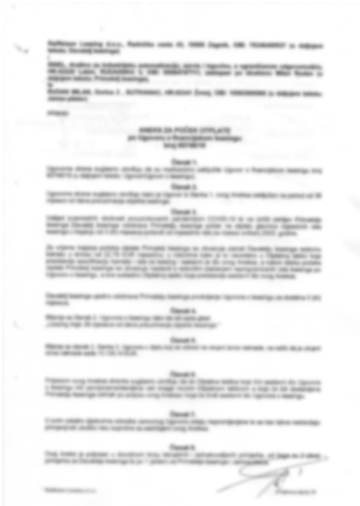
Slika 10. Novi aneks ugovora s otplatnom tablicom