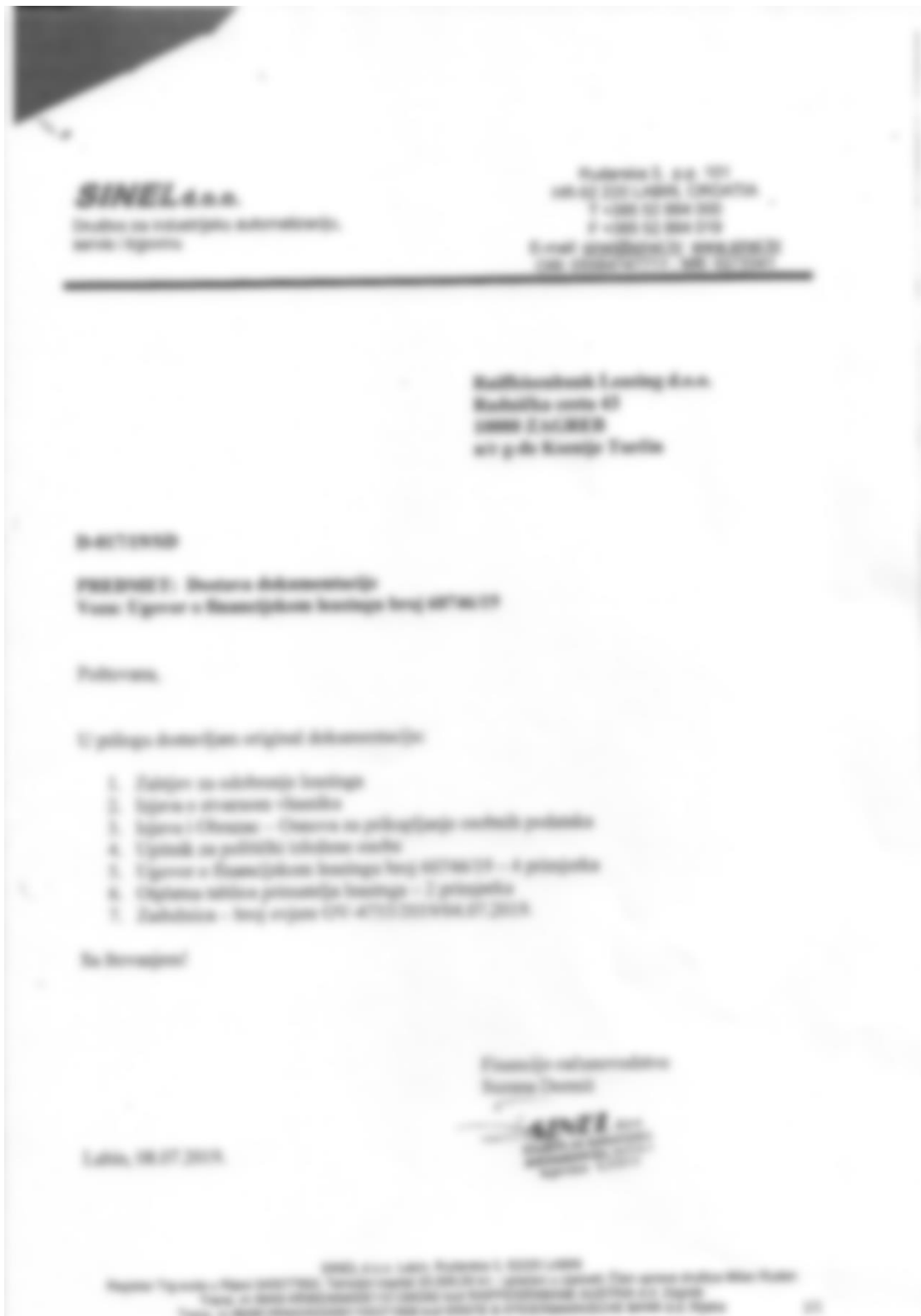
Slika 4. Dokument o dostavi potrebne dokumentacije za sklapanje ugovora o financijskom leasingu