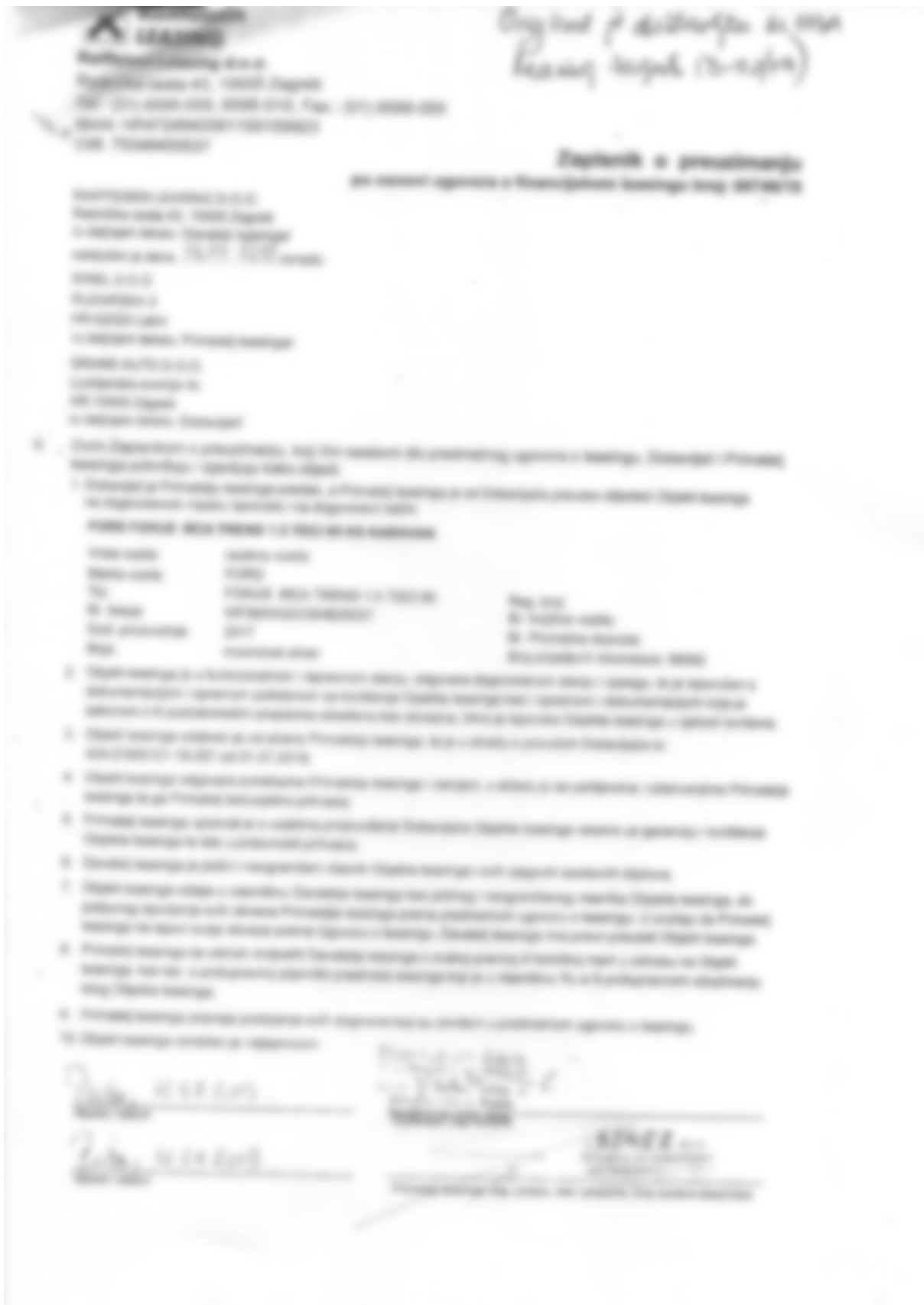
Slika 8. Zapisnik o preuzimanju