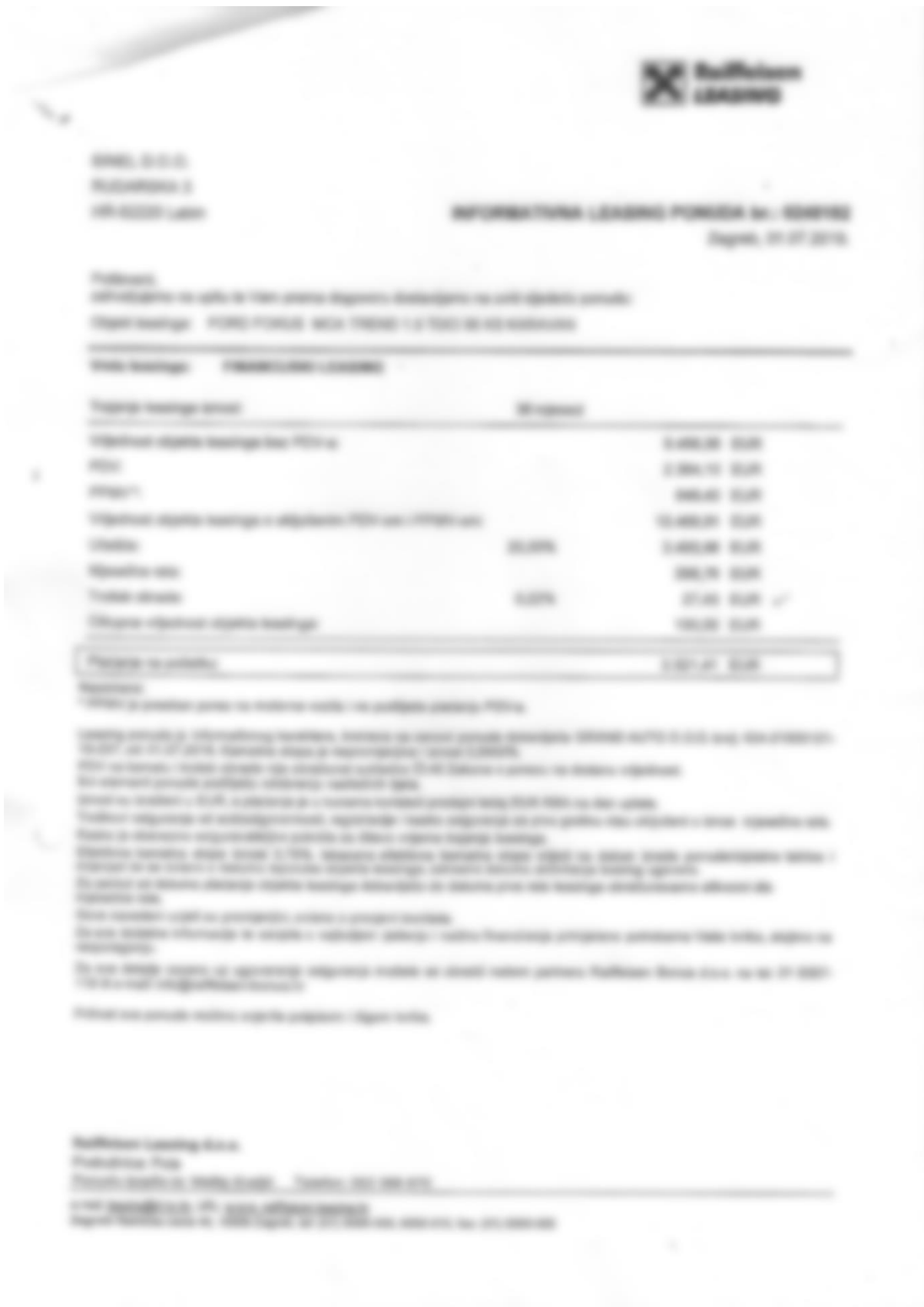
Slika 3. Informativna leasinga ponuda br.0248182