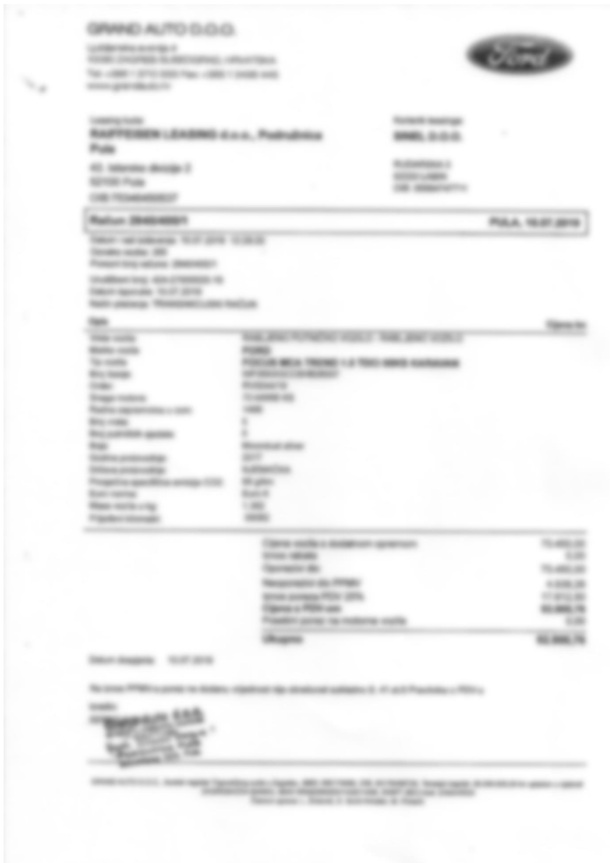
Slika 7. Račun