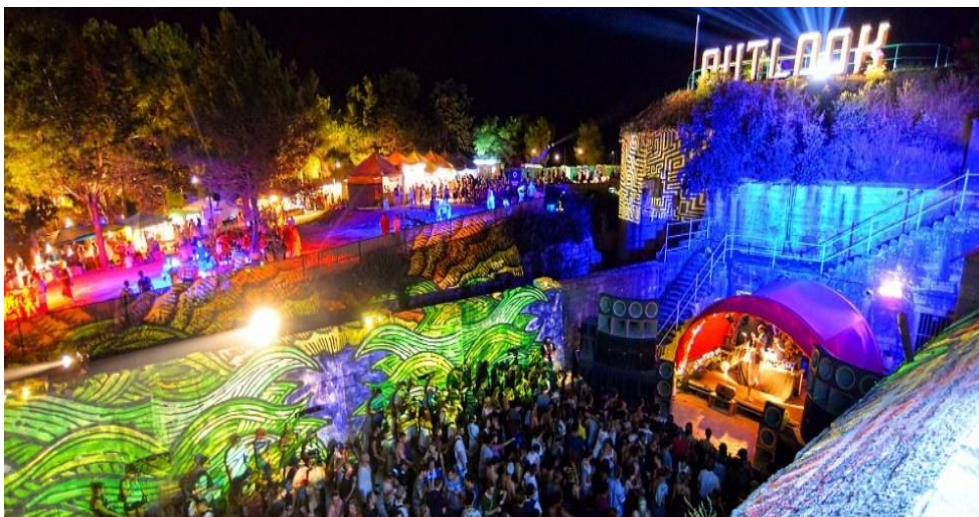
Slika br.4: Outlook festival

Udruga Seasplash partner je i u realizaciji Outlook festivala, jednog od najvećih europskih, ali i svjetskih festivala elektronske glazbe koji se održava u tvrđavi Punta Christo. U provedbi ovog projekta ostvarena je izuzetno kvalitetna suradnja s organizacijskim timom Outlook festivala iz Velike Britanije, a stvorili su se i čvrsti temelji za dugoročnu zajedničku suradnju kao i mogućnosti širenja daljnje međunarodne suradnje.