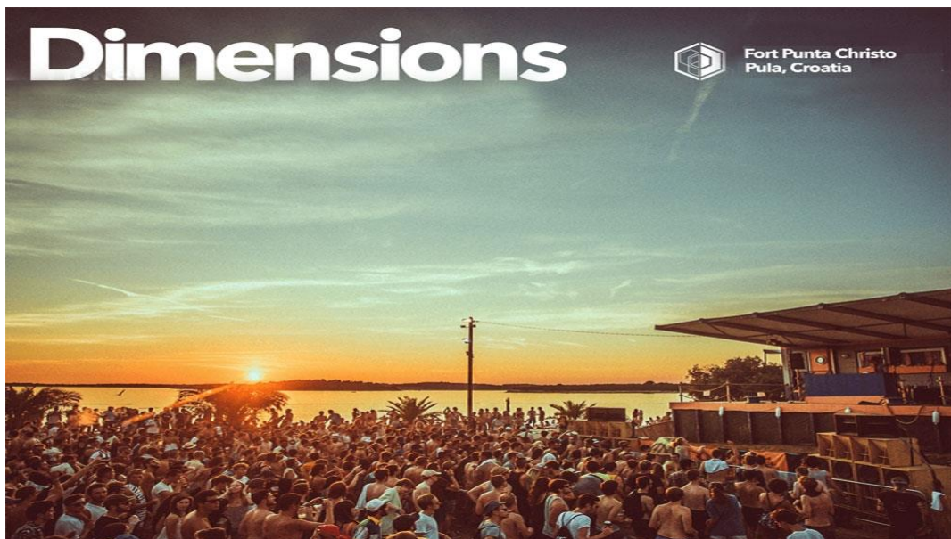
Slika br.5: Dimensions festival

Još jedan nadaleko poznat festival je i čuveni Dimensions festival koji se održava na poluotoku i tvrđavi Punta Christo u Štinjanu, redovito dovodi neka od najvećih imena svjetske elektronske glazbe. Posjetitelji ovog spektakularnog festivala uživaju u nastupima više stotina izvođača, na niz dnevnih i noćnih pozornica, u zabavama na brodovima i kamp uz plažu. Izvođači na festivalu predstavljaju najbolje od house, techno, jazz, funk, soul, drum and bass, psych i pop glazbe... Festival se otvara koncertom u Areni. 24