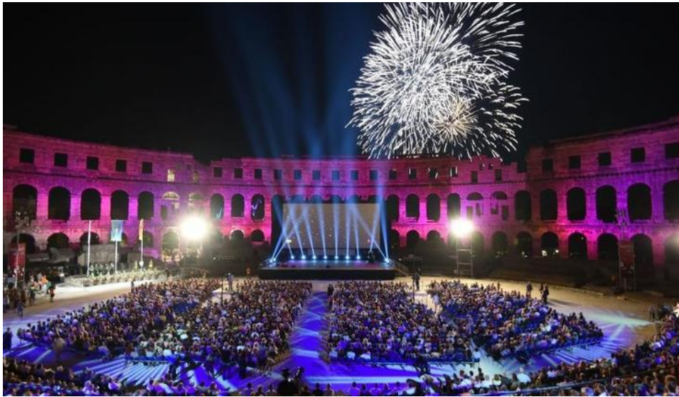
Slika br.1: Pula Film Festival