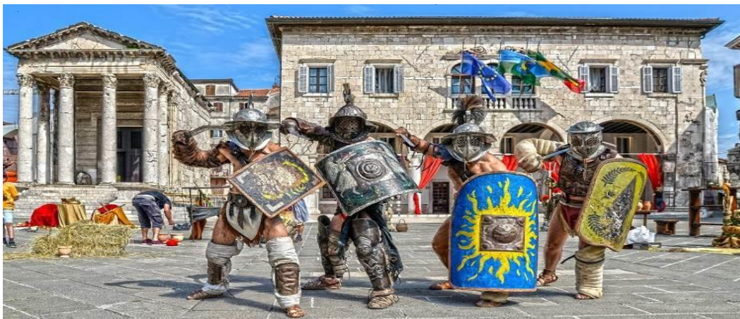
Slika br.3: Dani Antike

Još jedan vrlo zanimljiv festival je festival Dani antike — Pula Superiorvm. I 2019. godine donosi uzbudljive i događajima ispunjene dane iz bogate antičke povijesti. On je odgovor na potrebu za stvaranjem prepoznatljivog glazbeno-scenskog, edukativnog događaja koji će svima koji to žele približiti izrazito vrijedan dio tri tisućljetne povijesti grada i njegove okolice. Sve će se zbivati na antičkom trgu Forumu, na prostoru ispred izvrsno očuvanog Augustovog hrama i gradske Palače koji su se dokazali kao izvrsna kulisa za iznimno sadržajan i bogat program. Atraktivna je i borba gladijatora koja se održava u Areni u sklopu povijesno-zabavnog programa Spectacvla Antiqua. 22