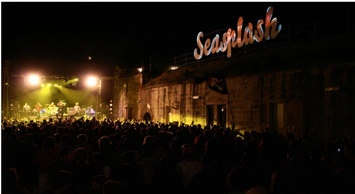
Slika br.6: Seasplash festival

Predstavljajući cjelokupnu bass glazbu i promovirajući soundsystem kulturu, Seasplash je već više od desetljeća prava poslastica za sve ljubitelje reggae, dub, drum'n'bass, dancehall, jungle, ska ali i ostale srodne elektronske glazbe. 25