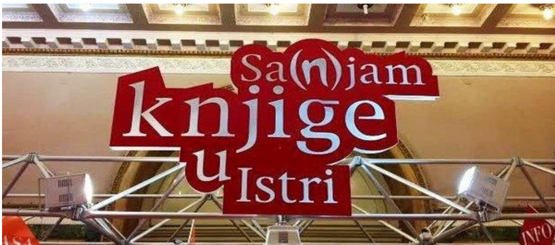
Slika br.2: Sa(n)jam knjige u Istri

Još jedan nadaleko poznat i vrlo posjećen festival u Puli je svakako Sa(n)jam knjige u Istri koji se profilirao kao festival autora i nakladnika. Sajak posjeti ga od 60 do 80 tisuća ljudi. Sa(n)jam knjige prati i cijeli niz događanja promocija knjiga i autora, okruglih stolova, panel diskusija, stručnih skupova, izložbi, performansa, filmova, koncerata. Cijene knjiga su snižene i do 70 posto. Održava se u Domu hrvatskih branitelja. 20