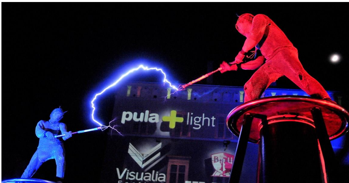
Slika br.7: Visualia

Šesta godina održavanja festivala dokaz je njegove vrijednosti i potencijala za razvoj konkurentnosti i jačanje prepoznatljivog destinacijskog imidža koji Pula predstavlja i kao grad svjetla, jer je Visualia 2016. godine uvršten u kalendar svjetskih svjetlosnih festivala. 26