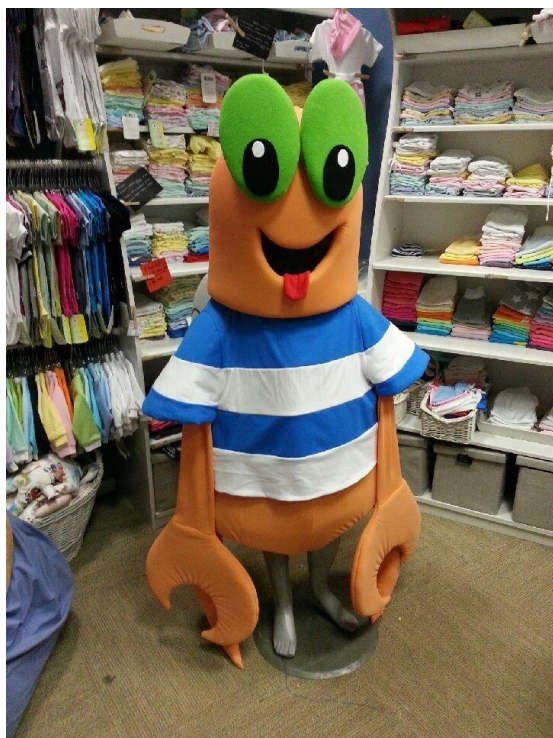
Slika 3. Maskota Maro