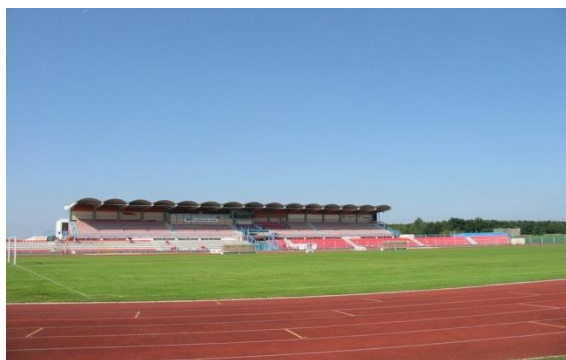
Slika 2. Nogometno igralište

Stadion SRC Mladost uglavnom se koristi za odigravanje domaćih utakmica nogometnih klubova Čakovec i Međimurje, kao i za održavanje raznih atletskih natjecanja. Objekt se sastoji od nogometnih terena, atletske staze, terena za rukomet, košarku, odbojku, teretane, kuglane i boćališta.