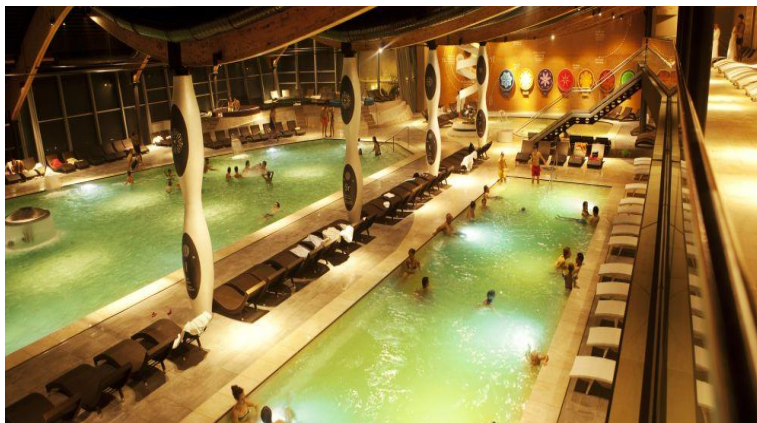
Slika 7. Izgled termomineralnih bazena