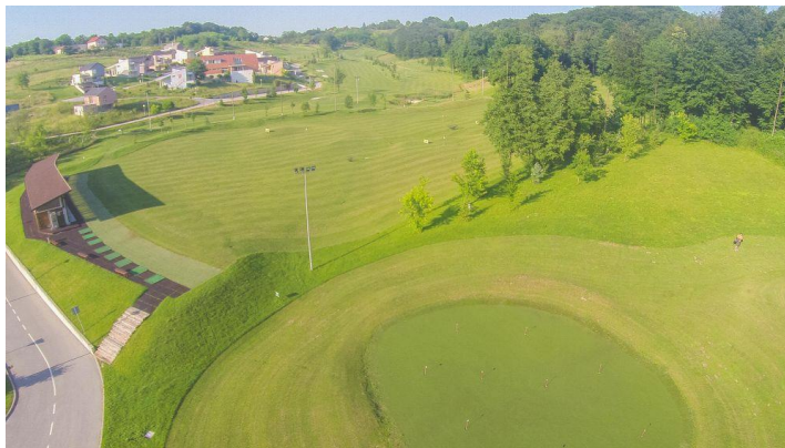
Slika 8. Golf igralište u sklopu Terma Sveti Martin