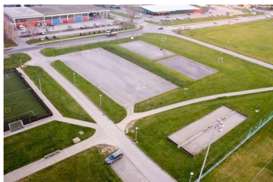
Slika 3. Boćalište i sportski tereni