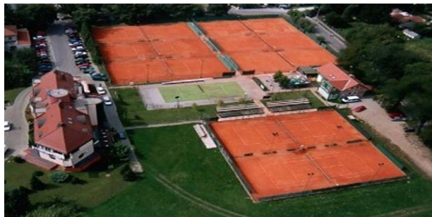
Slika 6. Teniski tereni „Franjo Punčec“