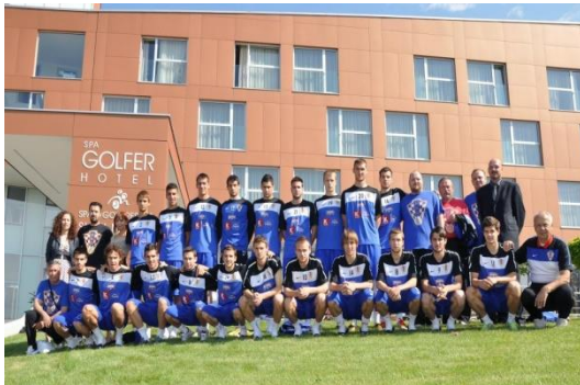
Slika 9. Hrvatska nogometna reprezentacija U21