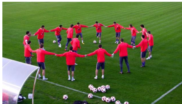
Slika 10. Pripreme nogometaša