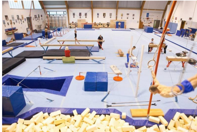
Slika 4. Gimnastička dvorana