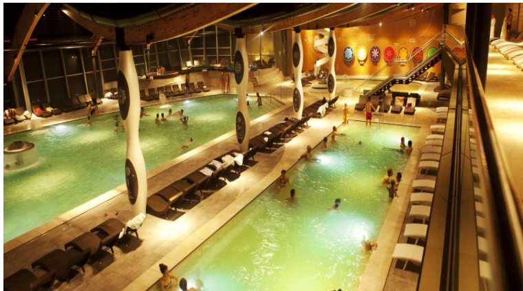
Slika 7. Izgled termomineralnih bazena