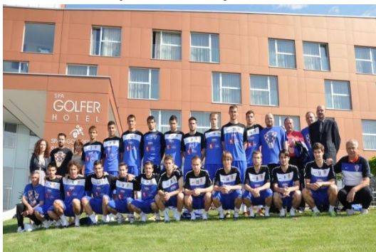
Slika 9. Hrvatska nogometna reprezentacija U21