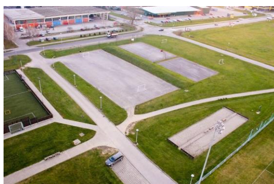
Slika 3. Boćalište i sportski tereni