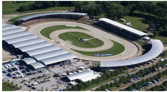
Slika 5. Speedway stadion