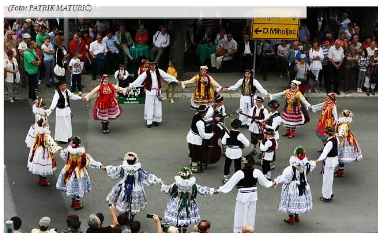
Slika 2.1. Naslovnica Glasa Slavonije 11