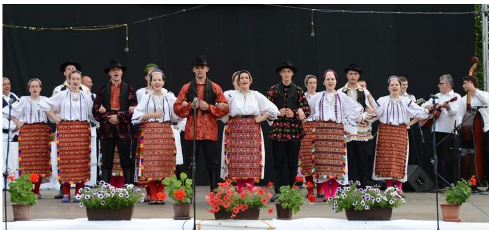
Slika 5.4. KUD „Lipovac“ Generalski Stol izvodi baranjski bečarac

Osim prikaza i održavanja tradicijskih običaja, izvođenja pjesama i plesova iz Generalskog Stola, KUD „Lipovac“ se bavi i koreografiranim folklorom. Točnije, prikazuje, izvodi i njeguje običaje, pjesme i plesove drugih krajeva Hrvatske pa tako i Slavonije, Srijema i Baranje. „Prilikom prikaza običaja ili izvedbe pjesama i plesova Generalskog Stola ili Panonske folklorne zone, izvođači bečaraca prije uvježbavanja moraju naučiti dobivene tekstove koje će izvoditi na sceni.“ 27