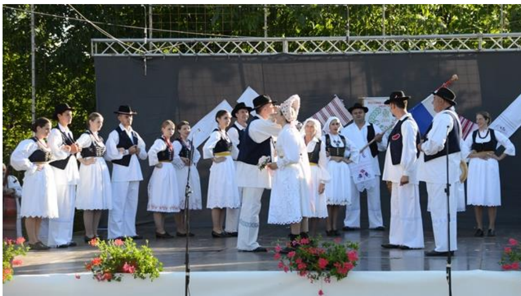
Slika 5.2. Prikaz svatovskih običaja (KUD „Lipovac“ Generalski Stol)

Svatovi su nešto drugačiji. Obitelji koje drže do tradicije svatove barem djelomično održavaju kao nekada, a one obitelji koje ne drže do tradicije, u svatovima imaju samo jednu tradicijsku scenu, a to je kićenje barjaka i barjaktara . KUD „Lipovac“ je 2015. godine prvi puta priredio i izveo glazbeno-scenski prikaz tradicijskog običaja svatova u Generalskome Stolu.