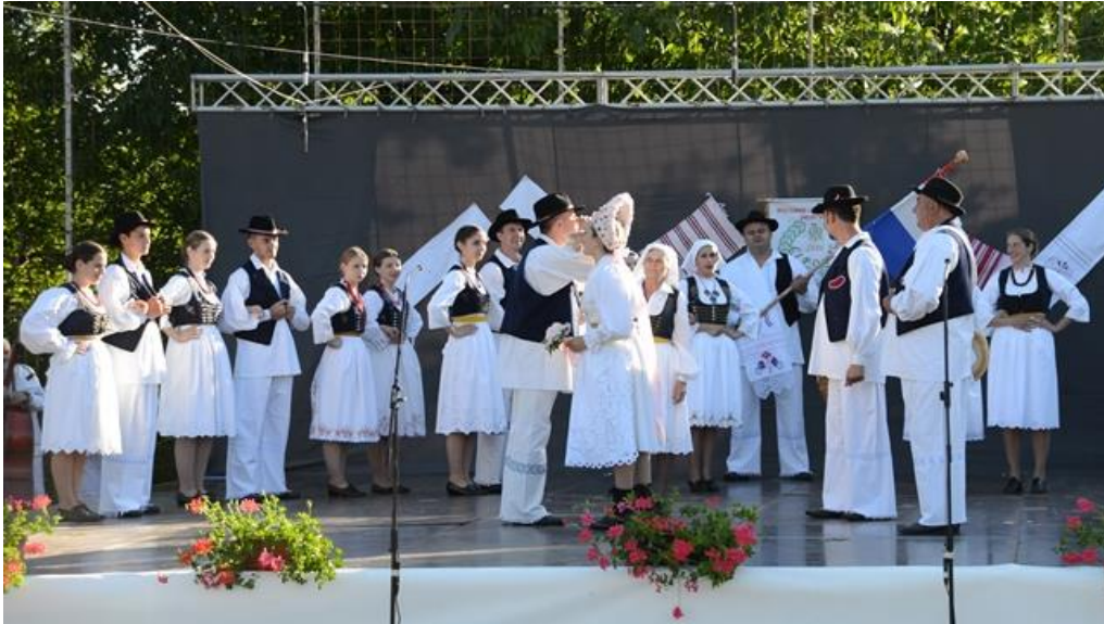
Slika 5.2. Prikaz svatovskih običaja (KUD „Lipovac“ Generalski Stol)

Svatovi su nešto drugačiji. Obitelji koje drže do tradicije svatove barem djelomično održavaju kao nekada, a one obitelji koje ne drže do tradicije, u svatovima imaju samo jednu tradicijsku scenu, a to je kićenje barjaka i barjaktara . KUD „Lipovac“ je 2015. godine prvi puta priredio i izveo glazbeno-scenski prikaz tradicijskog običaja svatova u Generalskome Stolu.