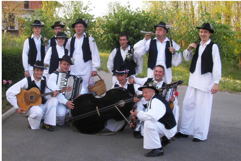
Slika 5.1. Jurjaši KUD-a „Lipovac“ Generalski Stol

Davno prije, dok su bake i djedovi bili mojih godina, život je bio puno drugačiji i nije bilo potrebe za nekim velikim slavljinama da bi ljudi zapjevali i zaplesali. „ Mi smo se prije najviše sastajali na paši. Dok bi čuvali ovce lipo bi zapivali, a ako je bilo svirača, onda bi i zatanjali. Tako nam je brže prolazilo vrime. “ 24 Tako se, između ostaloga, izvodio i bećarac, nekada uz instrumentalnu pratnju, a nekada bez nje. Na području Generalskog Stola bilo je mnogo običaja koji nisu prošli bez pjesama. Čijalo, žetve i pranje rubine na rijeci kao običaj se više ne održavaju, berbe voća i povrća se više ne održavaju kao običaji nego se obavljaju kao obični poslovi. Zahvaljujući KUD-u „Lipovac“, neki od običaja ipak se rekonstruiraju i danas. To su ophodi Jurjaša 25 večer uoči Jurjeva, paljenje Ivanjskoga krijesa noć uoči Ivanje, obilazak mjesta u vrijeme maškara i spaljivanje lutke Fašnika te pisanje uskršnjih pisanica perom i voskom.