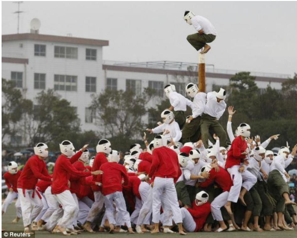
slika 11