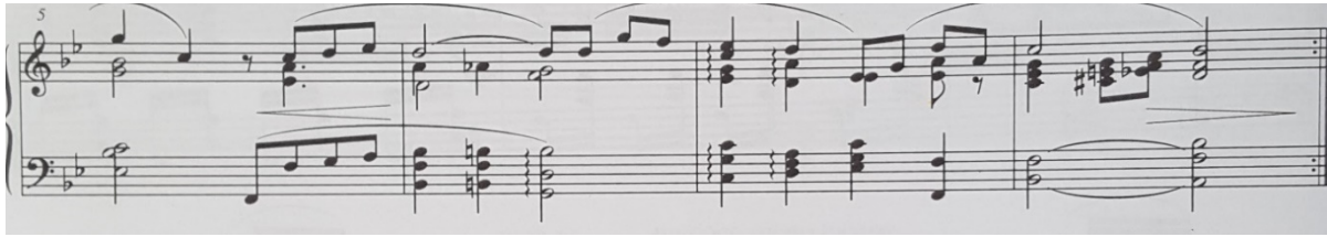
Slika 5. Notni zapis: Ljubice (Veilchen), op. 19, br. 2

Izvor: Pejačević, D., priredila Gamulin I. (2005). Glasovirske minijature . Zagreb: Muzički informativni centar Koncertne direkcije, str. 34.