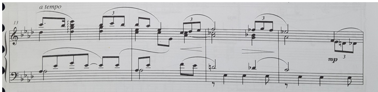
Slika 11. Notni zapis: Potočnice (Fergismeinnicht), op. 19, br. 4

Uz jasne tonalitetno-funkcionalne odnose koji se javljaju i prilikom širenja tonaliteta u smislu sekundarnih dominantni kratkotrajno se javljaju i alterirani akordi koji nemaju direktno razrješenje u privremene tonike kao što je to slučaj u 15. taktu kad se uz akord d-f-as-ces u gornjim dionicama, u basu javlja ton es koji na kratko daje dojam razrješenja navedenog akorda. Slično tome, u nastavku se javlja terckvartakord des-fes-g-b (sedmog stupnja As-dura) koji se iznad ležećeg tona dominante u basu (tona es ) rješava u sekstakord prvog stupnja (16. takt).