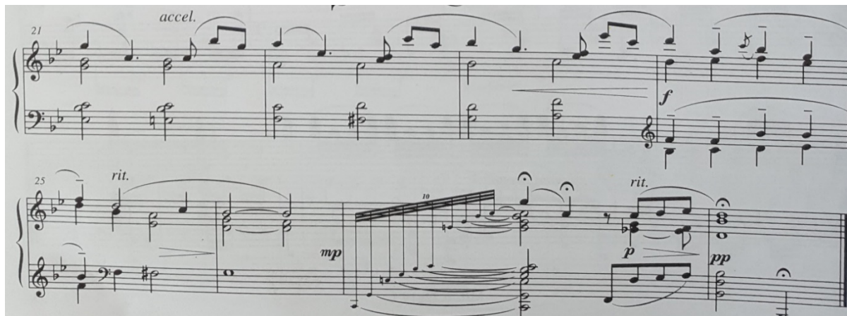
Slika 7. Notni zapis: Ljubice (Veilchen), op. 19, br. 2