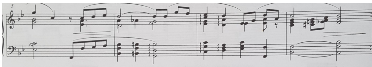
Slika 5. Notni zapis: Ljubice (Veilchen), op. 19, br. 2