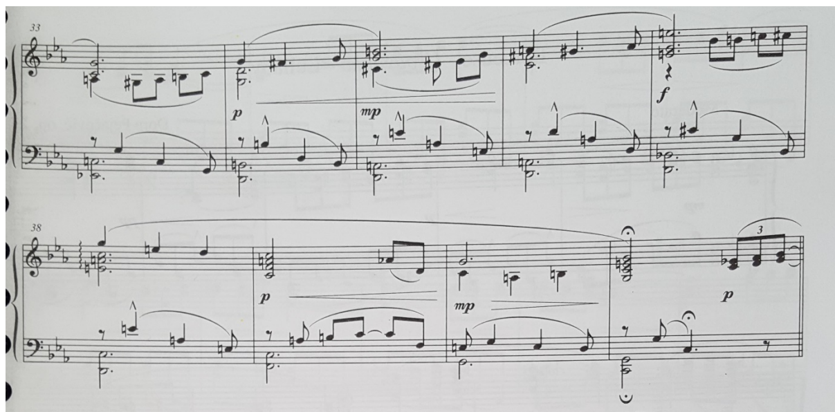
Slika 20. Notni zapis: Krizanteme (Chrysanthemen), op. 19 br. 8

Izvor: Pejačević, D., priredila Gamulin I. (2005). Glasovirske minijature . Zagreb: Muzički informativni centar Koncertne direkcije, str. 48.-49.