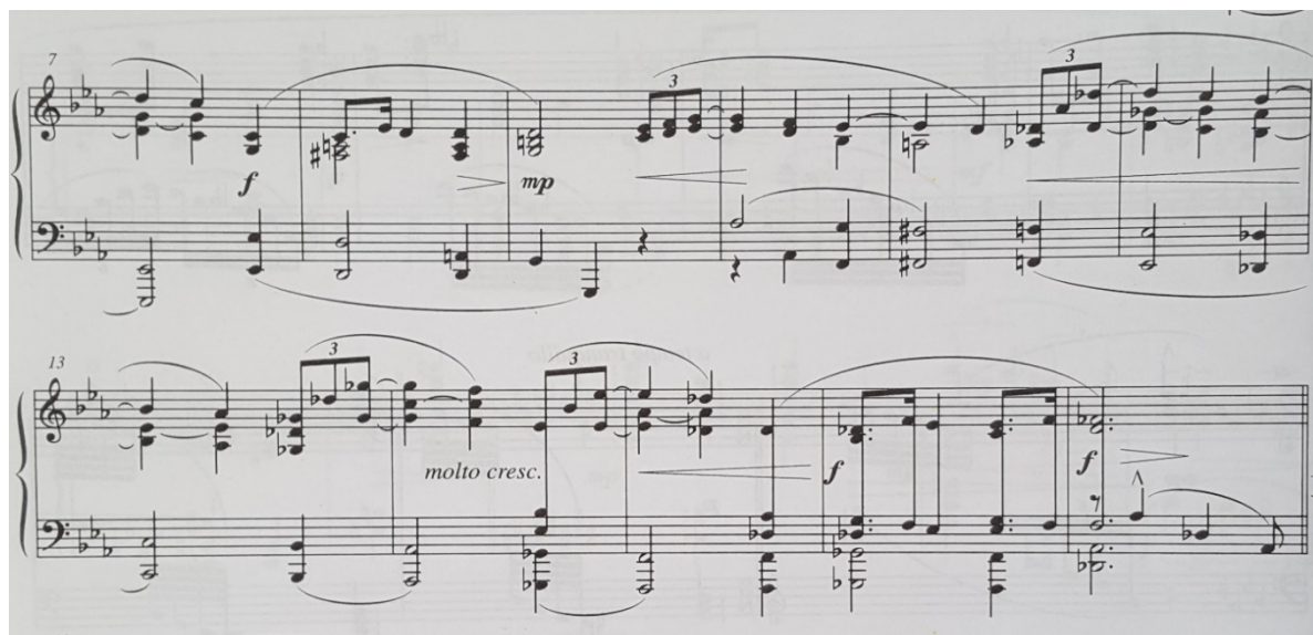
Slika 19. Notni zapis:Krizanteme (Chrysanthemen), op. 19 br. 8

Izvor: Pejačević, D., priredila Gamulin I. (2005). Glasovirske minijature . Zagreb: Muzički informativni centar Koncertne direkcije , str. 48.-49.