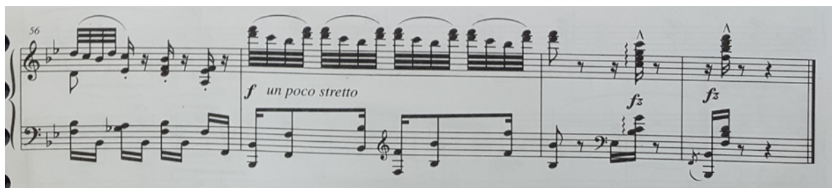
Slika 3. Notni zapis: Visibabe (Schneeglöckchen), op. 19, br. 1