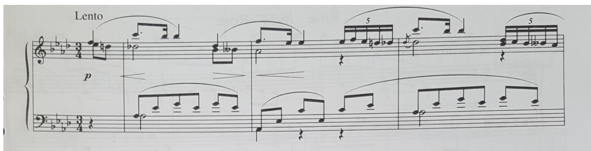
Slika 10. Notni zapis: Potočnice (Fergismeinnicht), op. 19, br. 4

Često se u harmonijskom izričaju Dore Pejačević javljaju dvostruke harmonije pa tako i na samom početku Potočnice : u prvom taktu nad pedalnim tonom tonike As-dura javlja se u gornjim glasovima dominantni septakord es-g-b-des ( sa appoggiaturom c ). Pred kraj takta javlja se i smanjena kvinta navedenog dominantnog septakorda u vidu kromatskog prohoda. Navedena se dominantna harmonija javlja kao svojevrsna appoggiatura nad toničku harmoniju koja nastupa u drugom taktu (ton f je appoggiatura ).