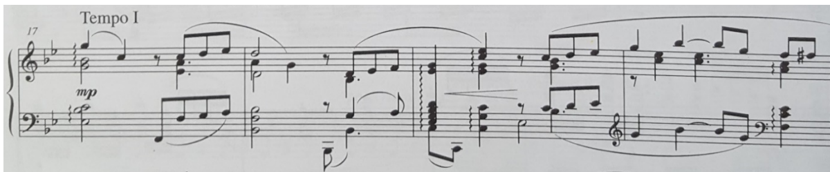
Slika 6. Notni zapis: Ljubice (Veilchen), op. 19, br. 2

U oslikavanju kolorističkog trenutka impresionističkog tipa Pejačevićeva koristi terčna proširenja akorda do nonakorda i na sporednim stupnjevima. Tako se u 19. taktu javlja nonakord drugog stupnja B-dura ( c-es-g-b-d ).