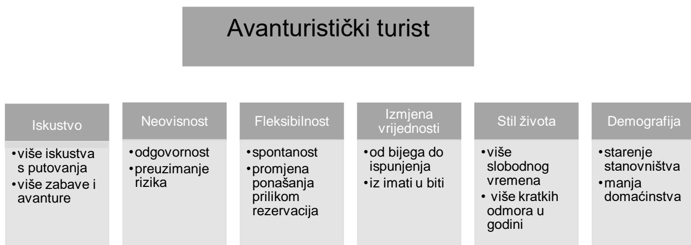
Slika 1. Karakteristike avanturističkih turista