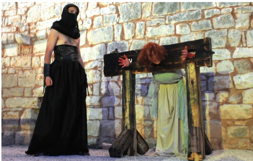
Slika 2. Vještica Mare u izvedbi Istre Inspirit

Osim kazališne priredbe doživljaj uključuje piće dobrodošlice, razgled kaštela Grimani – Morosini, prezentaciju starih zanata, degustaciju autohtonih proizvoda, glazbeni sastav Nešpula i pučku večeru i piće (Istra Inspirit, https://www.istrainspirit.hr/ , preuzeto 05.07.2019.). Na temelju legende o vještici Mare postoji i njezina kuća u Svetvinčentu. Ona posjetiteljima nudi virtualno putovanje i upoznavanje s legendom. Vještičinu priču priča upravo njezin duh koji posjetitelje vraća u prošlost. Stavlja posjetitelje u glavnu ulogu u bitci za obranu kaštela, kojeg će braniti virtualnim streličarstvom. Pomoću VR naočala posjetitelji će moći i sudjelovati u potrazi za izgubljenom opremom nepoznatog konjanika te će biti u mogućnosti vratiti se u prošlost.