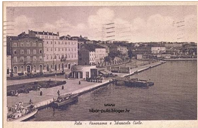
Slika 4. Idroscalo Ernesto Gramaticopulo

hidroavion srušio hidroavion baruna Gotfrieda von Baumfielda, iznad Koparskog zaljeva. 57