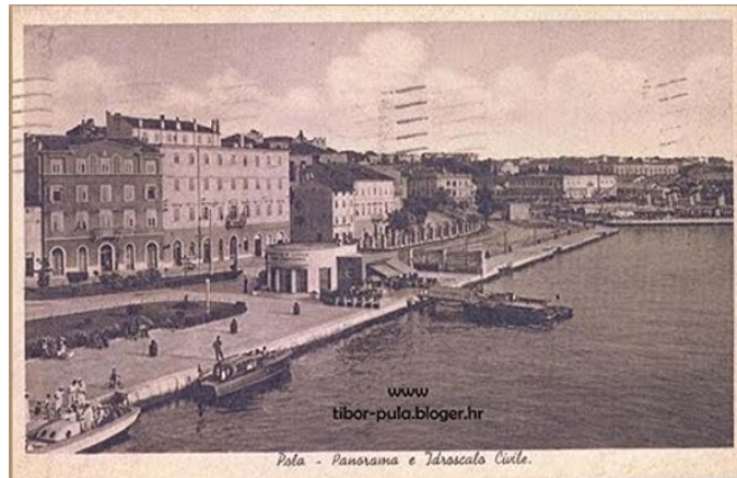
Slika 4. Idroscalo Ernesto Gramaticopulo

hidroavion srušio hidroavion baruna Gotfrieda von Baumfielda, iznad Koparskog zaljeva. 57