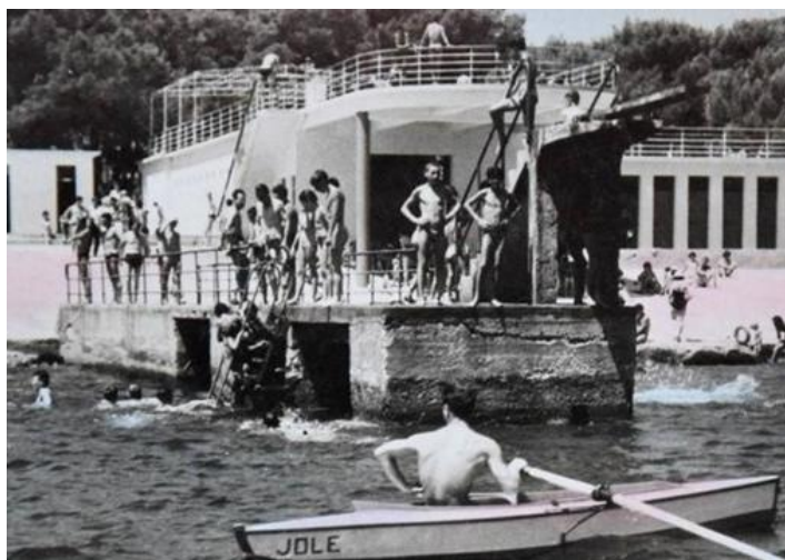
Slika 3. Kupalište Stoja, arhitekta Enrica Trolisa