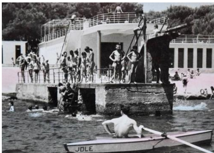
Slika 3. Kupalište Stoja, arhitekta Enrica Trolisa