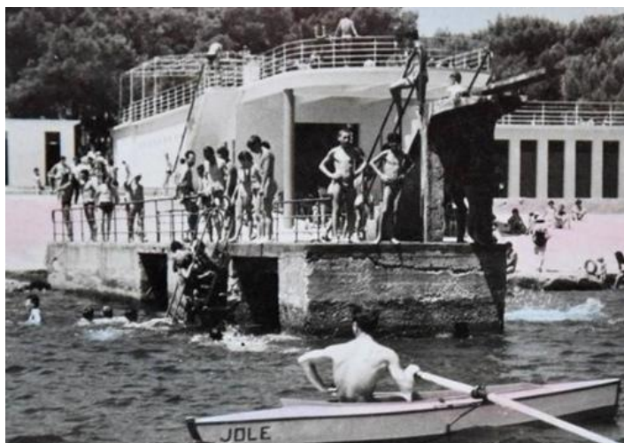
Slika 3. Kupalište Stoja, arhitekta Enrica Trolisa