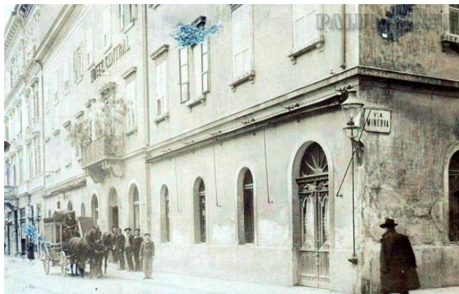
Slika 2. Hotel Centrale na uglu Via Minerva (današnja Maksimijanova ulica)