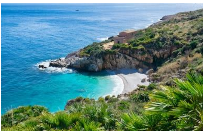
Slika 14. Prirodni rezervat Zingaro