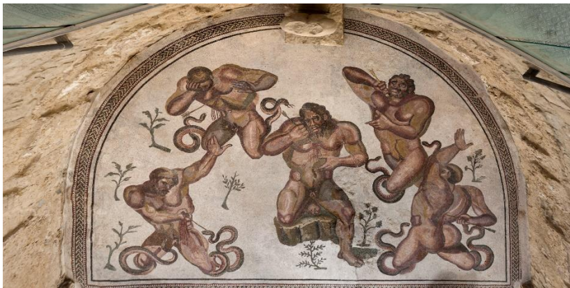
Slika 10. Mozaici u Villa Romana del Casale