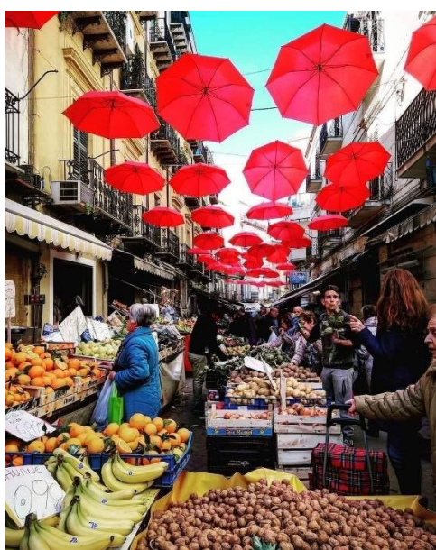
Slika 11. Strat'â Foglia