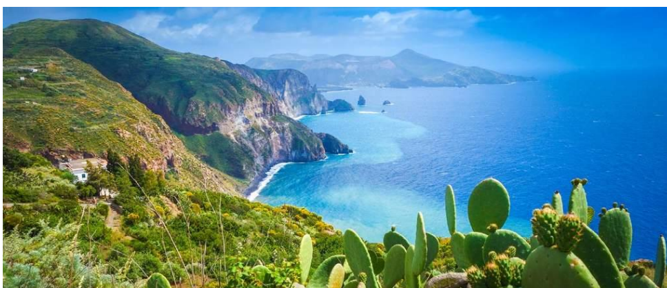
Slika 2. Liparski otoci