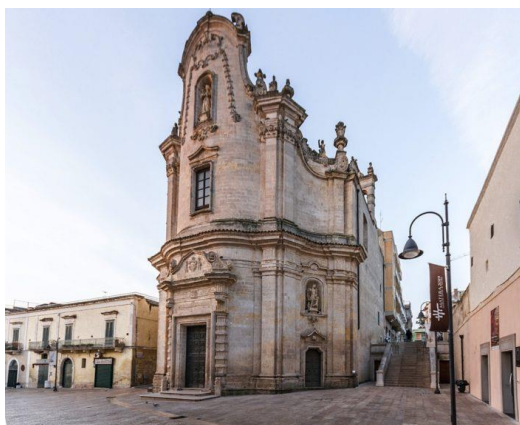
Slika 9. Chiesa del Purgatorio