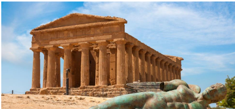
Slika 6. Konkordijin hram u Dolini hramova, Agrigento