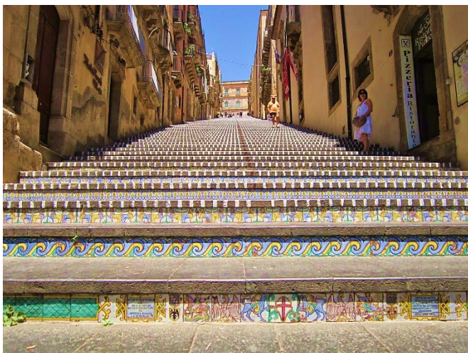
Slika 12. Stubište Crkve Gospe od brda