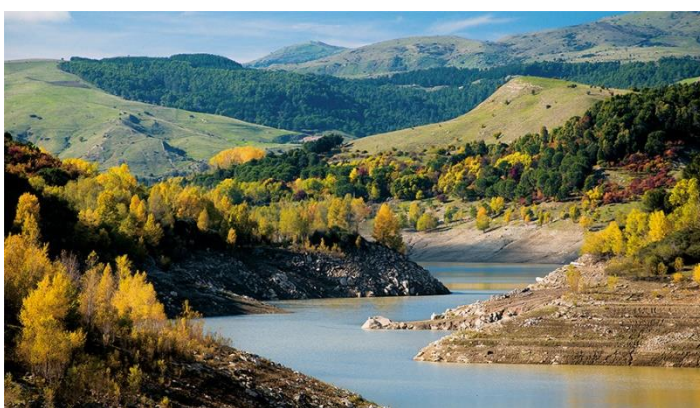
Slika 15. Park prirode Nebrodi