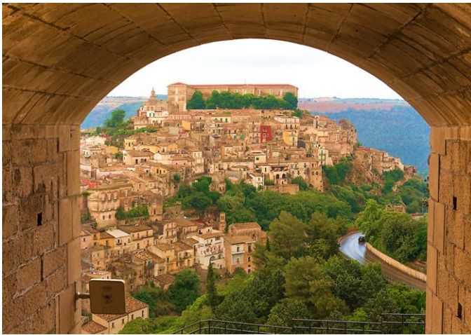
Slika 13. Ragusa Ibla