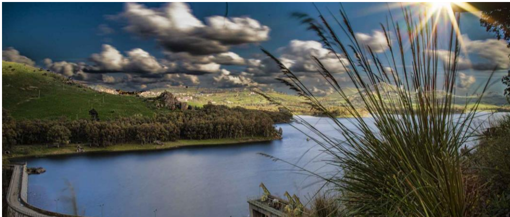
Slika 4. Jezero Pozillo