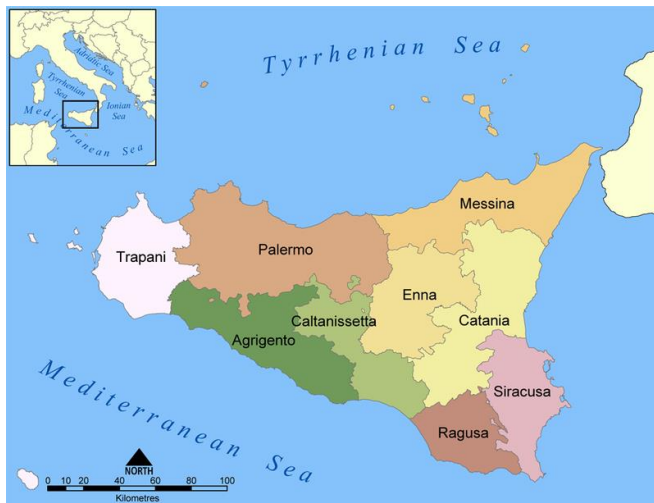
Slika 1. Provincije na Siciliji

Izvor: https://www.wikiwand.com/sh/Sicilija (25.4.2020.)