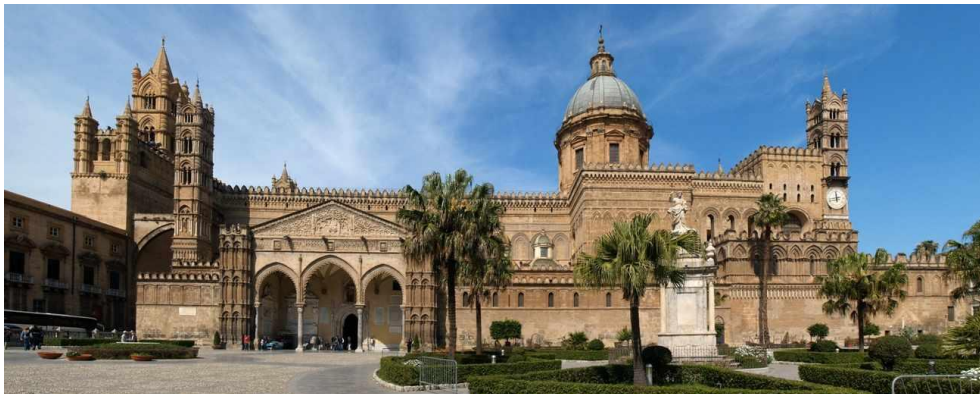
Slika 5. Katedrala u Palermu