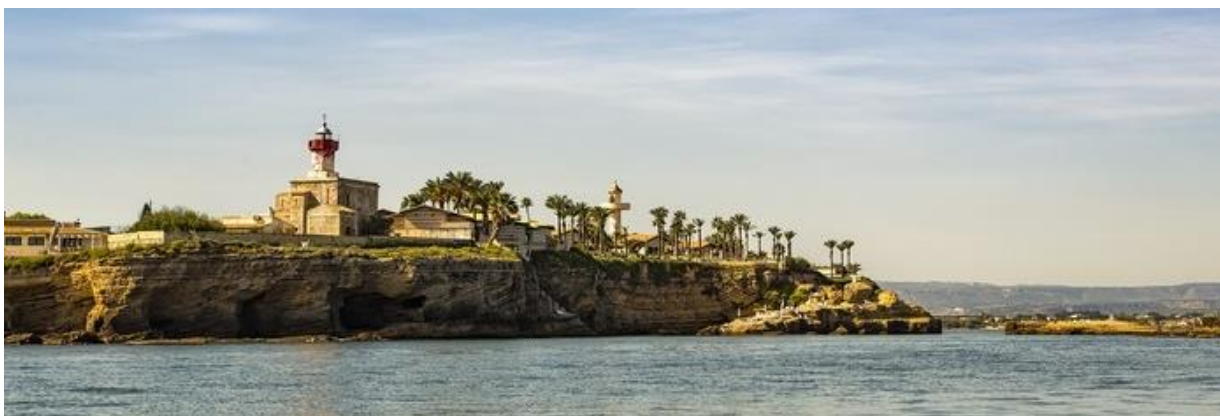
Slika 7. Otok Ortygia