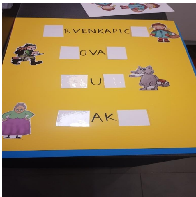
Slika 4. Centar početnog čitanja i pisanja „Dodaj slova“