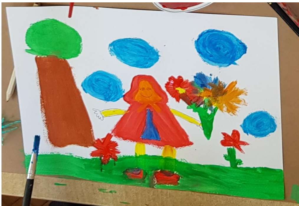
Slika 11. Crtež na temu Crvenkapica (djevojčica L., 6 g.)