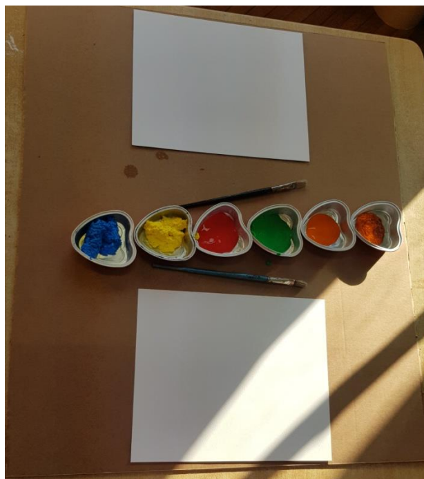
Slika 6. Likovni centar - slikanje