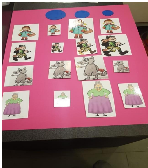
Slika 3. Centar početnog računanja "Premetaljka"