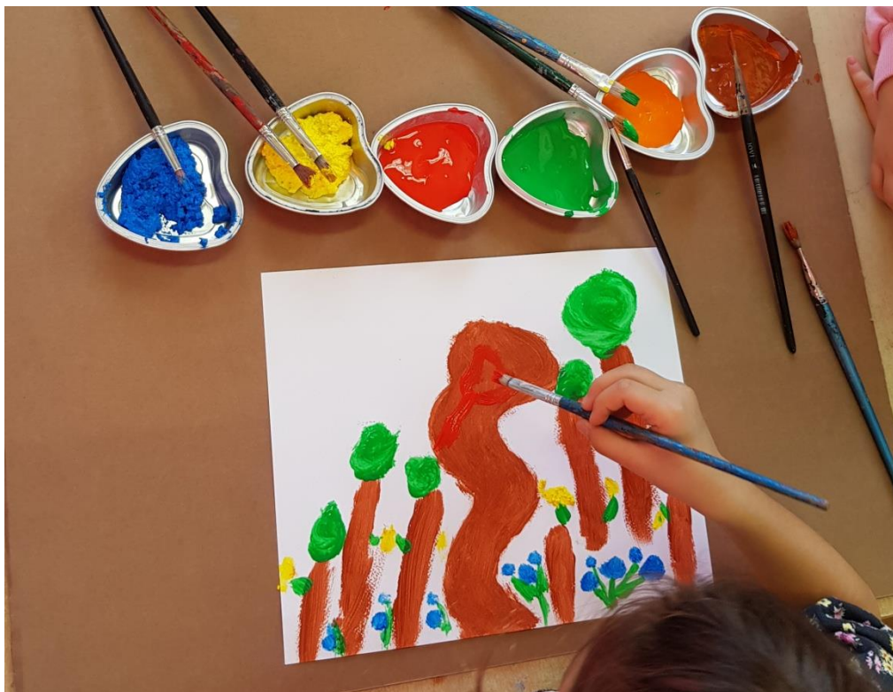
Slika 8. Crtež na temu Crvenkapica (djevojčica L., 6 g.)