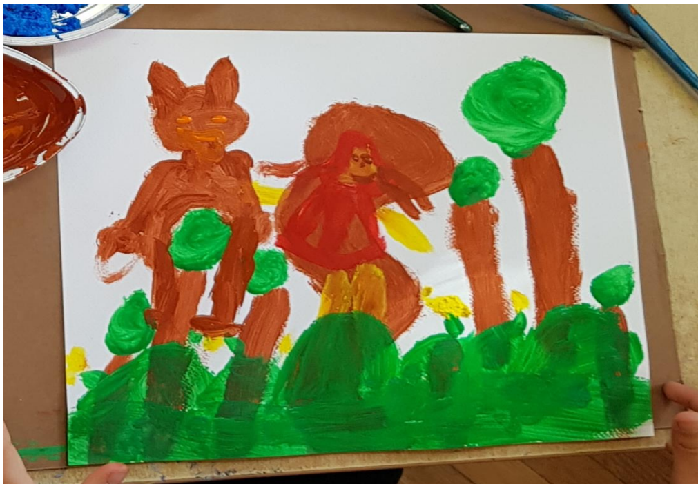
Slika 12. Crtež na temu Crvenkapica (dječak D., 6 g.)