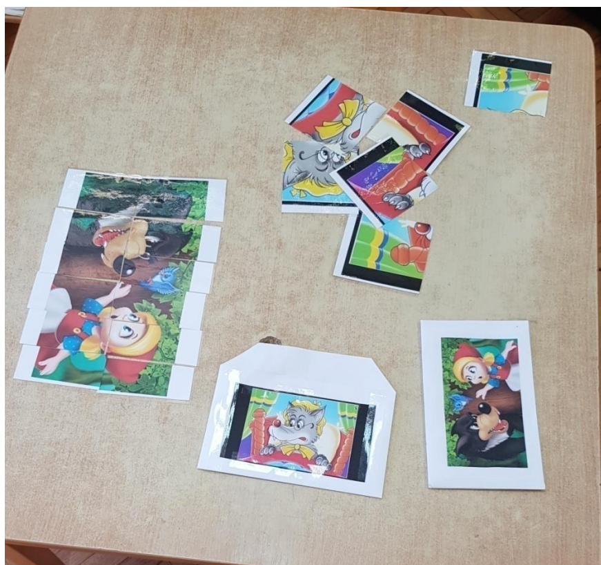
Slika 7. Stolno-manipulativni centar „Puzzle“