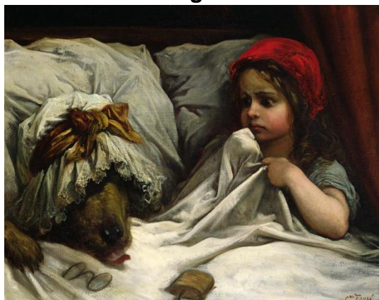
Slika 1. Ilustracija Gustavea Dorea, 1892. godina

Izvor: Little Red Riding Hood, c.1862 - Gustave Dore - WikiArt.org . Preuzeto: 16.