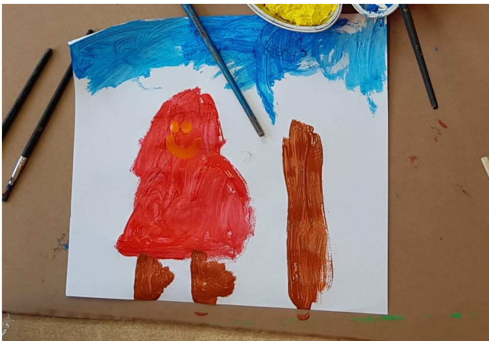
Slika 10. Crtež na temu Crvenkapica (dječak L., 6 g.)