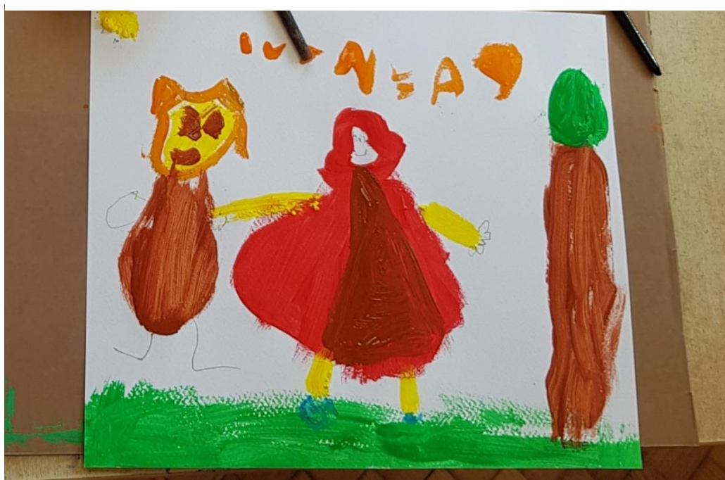
Slika 9. Crtež na temu Crvenkapica (djevojčica I., 6 g.)