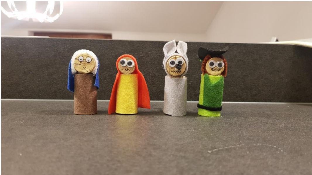
Slika 2. Figure likova od plutenog čepa

U građevnom centru ponuđeni su razni materijali: drveni štapići, kartonske kutijice lijekova, figure od plutenog češa, naljepnice i kartoni. Djeca su trebala od svih materijala samostalno izraditi labirint od svih materijala njemu bi na početak postavila Crvenkapicu, a na kraj bakinu kuću.