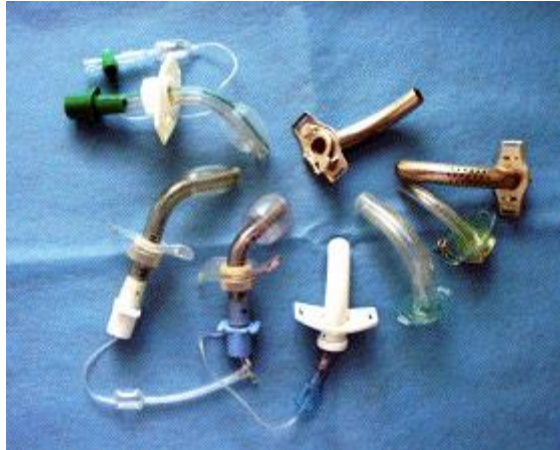
Slika 4. Trahealne kanile.