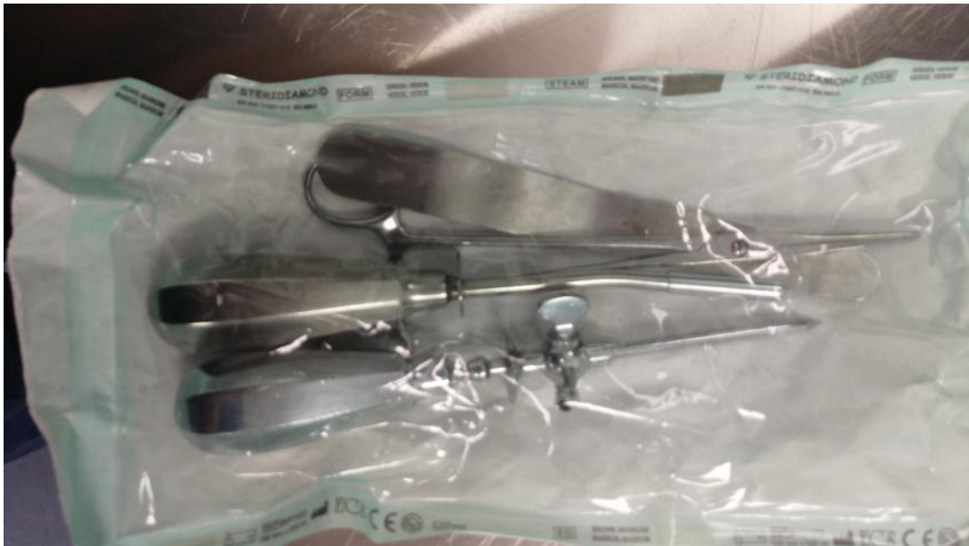
Slika 1. Spatula, konikotom sa vodilicom.

(Padovan, 1987) Set za konikotomiju čine: prekrivač bez rupe za stolić s instrumentima i materijal, prekrivač s rupom za pokrivanje pacijenta, spatula, konikotom sa vodilicom, jednokratni skalpel, sterilne rukavice za operatera i asistenta, sterilni tupferi, sterilni okrugli tupferi za dezinfekciju, aspirator, aspiracijski kateter, Yanquer guma sterilna za aspirator, Vigonova kanila s kafom, šprica od 10 ml, fiziološka otopina od 0,9%.