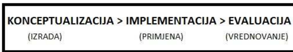
Slika 2: Faze modelskog pristupa baštini