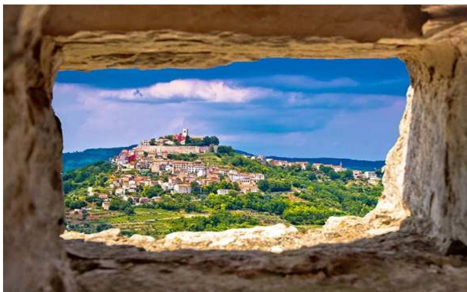
Slika 1: Pogled na Motovun