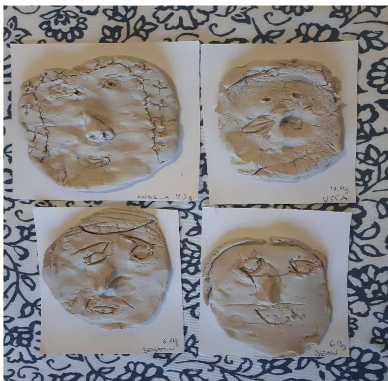
Slika 18: Radovi djece 2