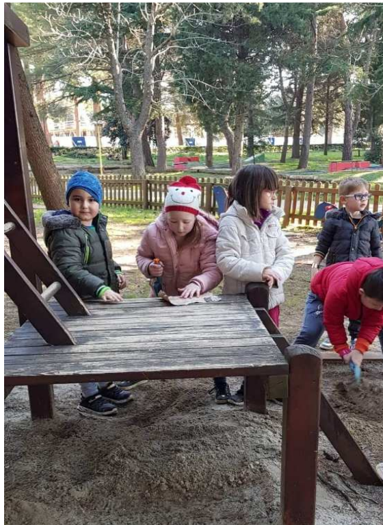
Slika 13: Potruga za „blagom“