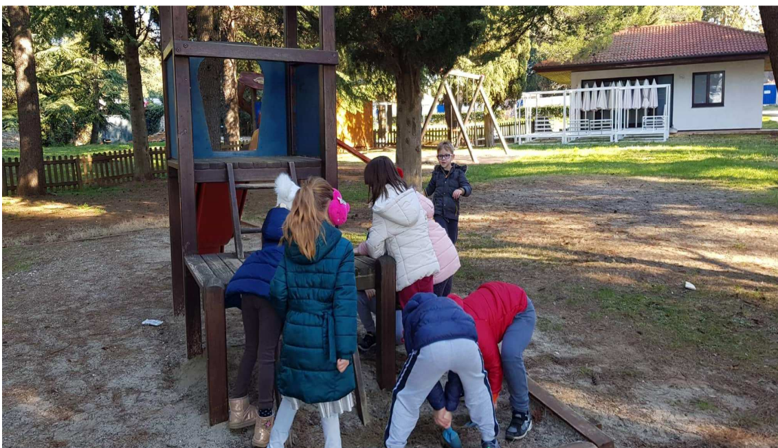
Slika 14: Nastavak potrage, svi se uključuju u potragu