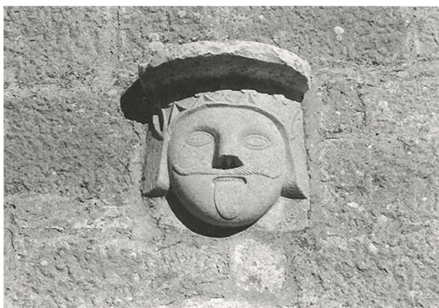
Slika 4: Lik Atila pokraj Vižinade