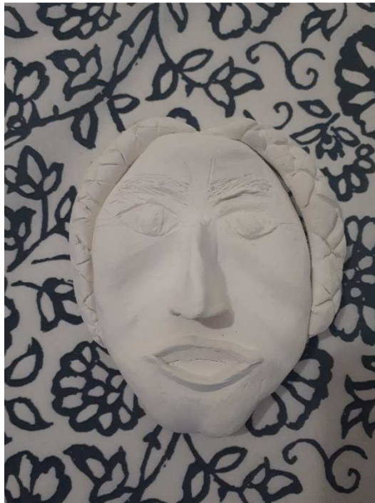
Slika 9: Atila - Kristina Prodan