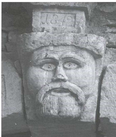
Slika 6: Lik Atila u Tinjanu

Izvor: http://istrianet.org/istria/architecture/urban/stoneheads/tinjan1.htm