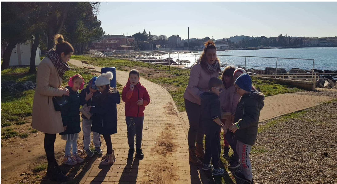
Slika 10: Podjela u grupe