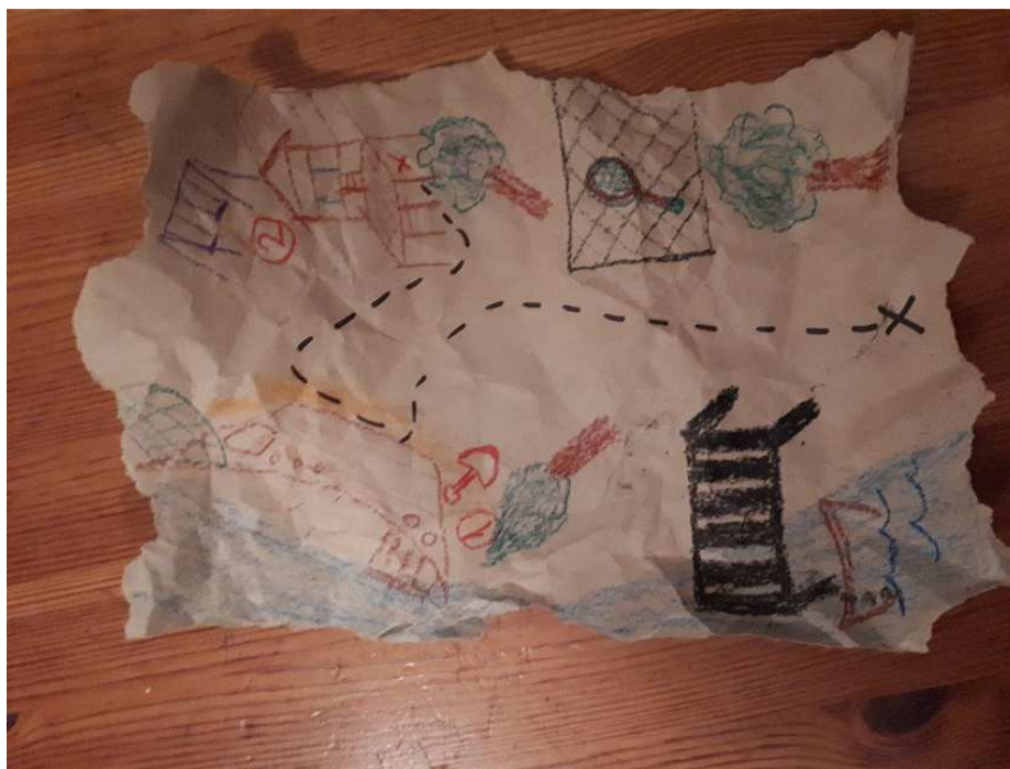
Slika 12: Detalji mape