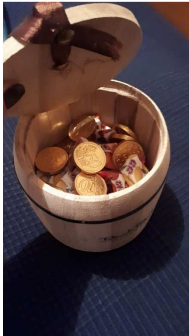
Slika 15: Ranije zakopano „blago“