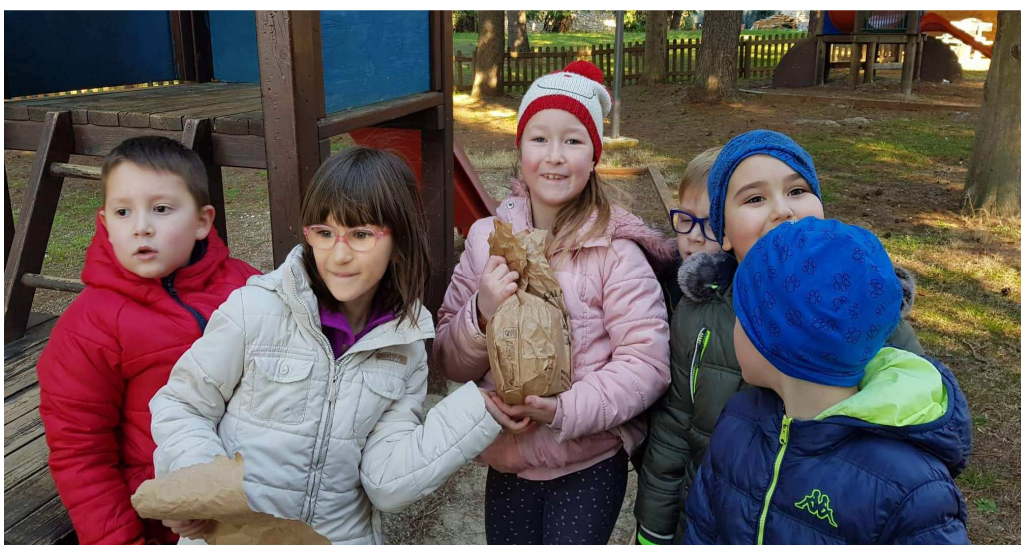
Slika 16: Pronalazak blaga