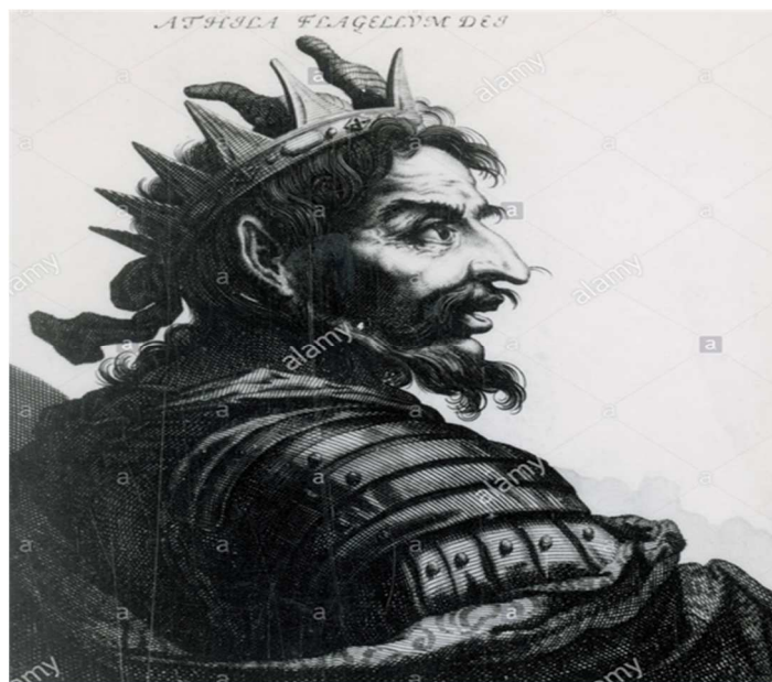
Slika 3: Atila