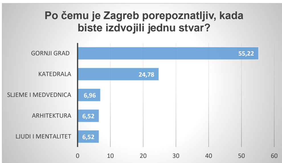
Graf 1: Prepoznatljivost Zagreba prema provedenoj anketi