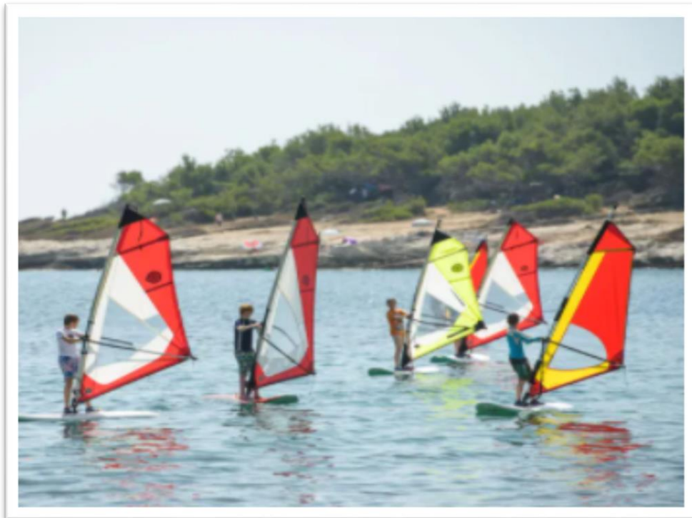
Slika 8.: Windsurfing na Kamenjaku

Zahvaljujući svojim klimatskim posebitostima te posebnom geografskom položaju, Kamenjak je popularno odredište " windsurfera ". Kako se na Kamenjaku izmjenjuju vjetrovi sa svih strana istočnih i zapadnih smjerova, surferi tijekom cijelog dana mogu uživati na dasci.