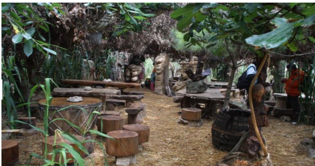
Slika 5.: Safari bar na Kamenjaku

Od ugostiteljskih objekata na Kamenjaku se mogu pronaći beach bar-ovi u uvali Pinižule, Polje, Debeljak, Školjić, Mali Portić i drugim uvalama, safari bar (Slika 5.) i restoran na istarskoj farmi boškarina (Slika 6.). Safari bar je kulturni bar smješten na plaži Mala Kolombarica na rtu Kamenjak. Bar je specifičan po tome što je izgrađen od živih biljaka i bambusovih štapića, koji dijele stolove i klupe, dok je pod napravljen od naslaganih blokova kamena, te od slame. U baru se nalaze i zabavni sadržaji za djecu, poput velikog tobogana od konopa i drvenih kotača, ljuljačka obješena na grane drveća. Bar je prava mala robinzonska oaza za opuštanje i uživanje u blagodatima koje nudi.