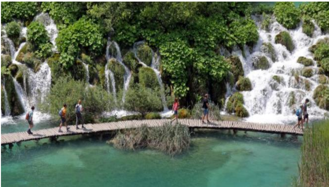
Slika 2.: Plitvička jezera

održivog razvoja turizma. „Plitvička jezera su na UNESCO-vu popisu svjetske baštine, one prirodne. I njima, poput Dubrovnika, prijeto da budu izbrisana s tog popisa. Kao i u slučaju Dubrovnika, i Plitvička jezera ugrožavaju pohlepa i glupost lokalnih vlasti i poduzetnika, što rezultira sve većim brojem turista te sve većim zagađenjem jezerske vode i okoliša. Već nekoliko godina Zelena akcija upozorava Sabor i druge slične adrese, kao i cjelokupnu javnost na pojačanu apartmanizaciju i komercijalizaciju NP-a Plitvička jezera koje je omogućio Prostorni plan područja posebnih obilježja Nacionalnog parka Plitvička jezera iz 2014., a koji se izravno kosi s primarnom zadaćom NP-a – zaštitom prirode“ (Popović, 2017., https://express.24sata.hr/top-news/politika-plus-biznis-plitvice-plivaju-u-fekalijama-13520 ). Plitvička jezera zahtijevaju provođenje strogih mjera održivosti, od kojih su neke već realizirane a to su regulacija broja posjetitelja putem kupovine ulaznica preko interneta, čime se utječe na smanjenje turističkih pritisaka na okoliš, zatim učestalo kontroliranje otpadnih voda od strane inspekcije, dok bi se ograničenje legalizacije gradnje novih apartmana tek trebalo provesti, kao i izgradnja sustava za zaštitu vode od fekalija, te provođenje učinkovitijeg gospodarenja otpadom.