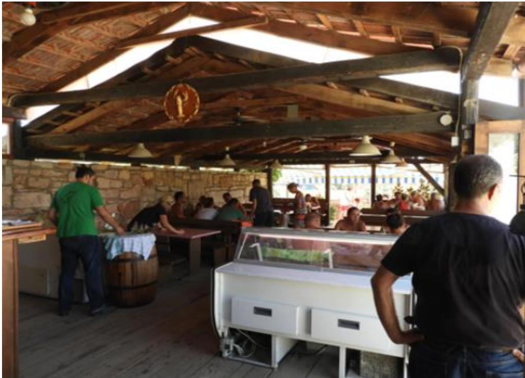
Slika 6.: Istarska farma na Kamenjaku