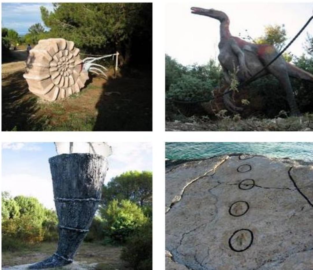
Slika 7.: Skulpture dinosaura na Kamenjaku – staza dinosaura