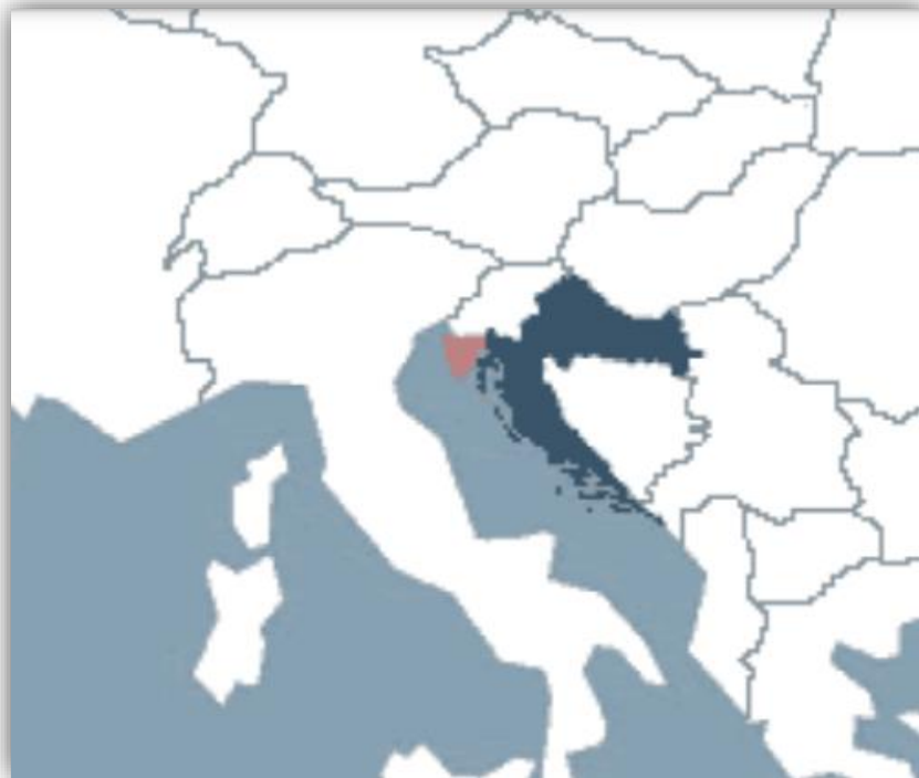
Slika 4.: Geografski položaj Istre